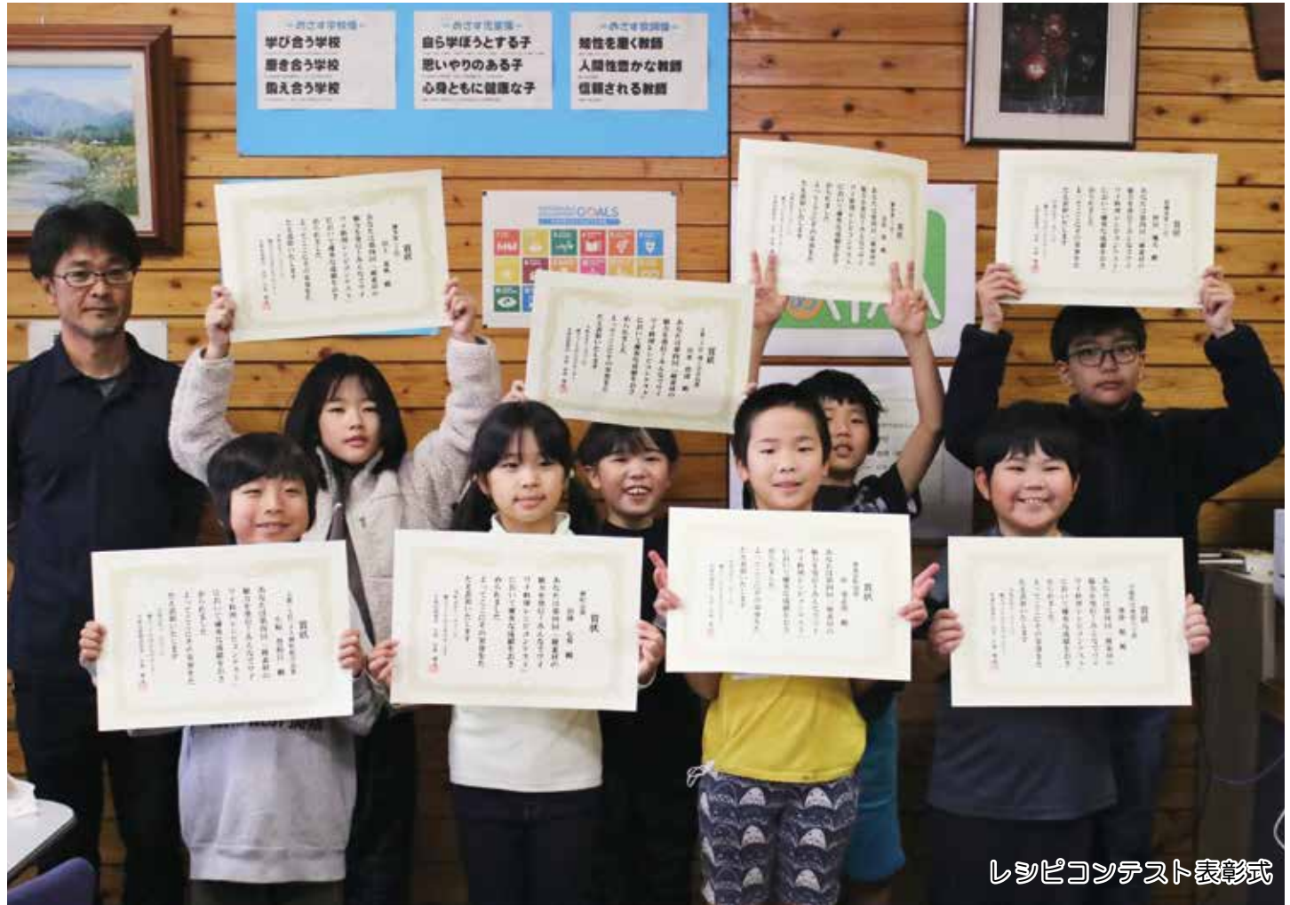
レシピコンテスト表彰式