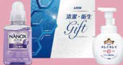
ライオン 清潔衛生ギフトセット