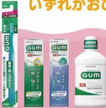
サンスターセット