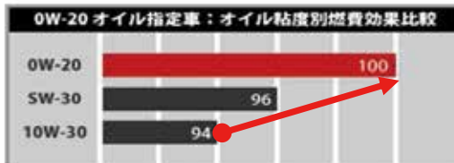
ねばねばオイルは摩擦が多い 動きが重たい

※10,000km走行時の結果です。 ※走行状態や運転状況により差が出る場合があります。