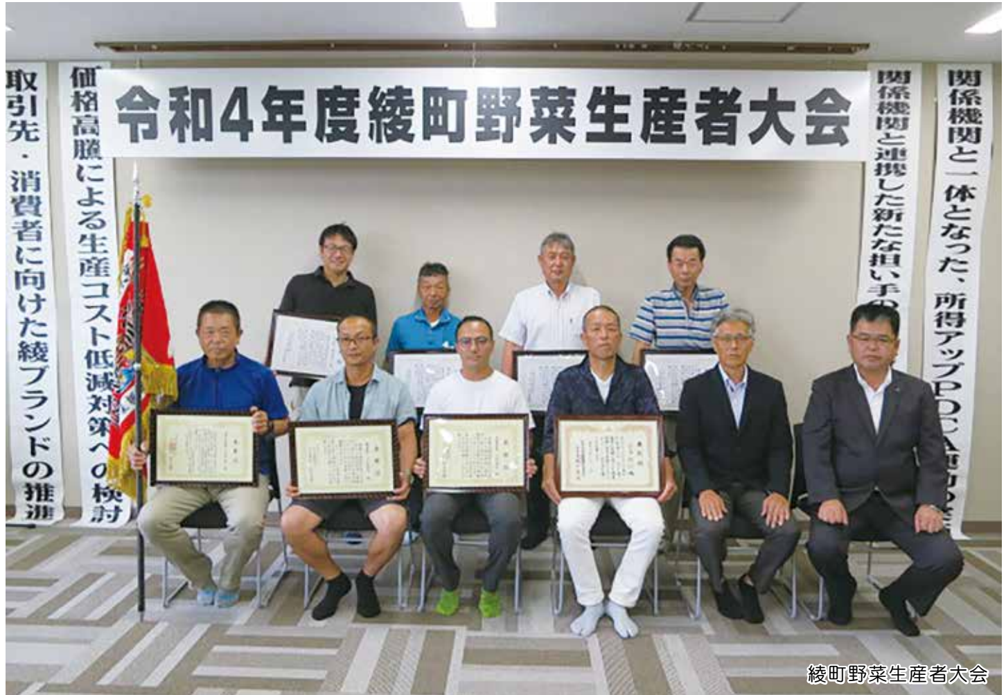
綾町野菜生産者大会