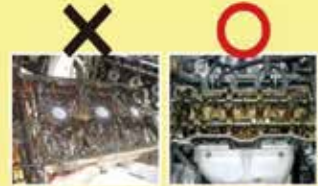
オイル交換をしてないエンジン内部