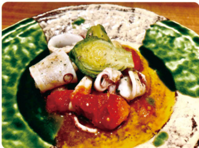
小ヤリイカと 芽キャベツの ガーリック炒め