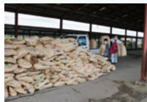
回収作業をするJ A職員