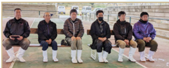
年間優秀賞と永年功労者賞の受賞者