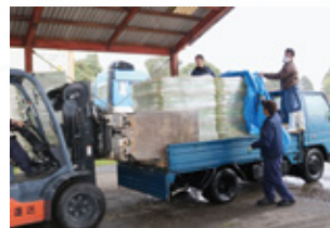
乾牧草の積み込み

オーツヘイの23年産は天候にも恵まれ、特に高品質品の収穫量が増加し産地相場は下げ基調にあります。次回の即売会は、4月下旬に開催を予定しています。