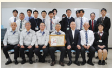
表彰を受けたJA尾鈴

2月19日、JA尾鈴は、JA共済連宮崎より、令和5年度の共済事業活動の取り組みが評価され、3年連続となる優績組合表彰を受けました。