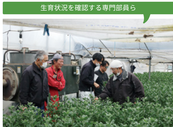
生育状況を確認する専門部員ら

いました。 農薬使用台帳は、正確に記入することで生産者意識の向上を図り、散布の回数や量なども指標に合わせることで改善に努めていくことを確認しました。 また、合併に伴う三角袋の在庫融通の方法や、北海道向けの青果販売についても検討を行いました。