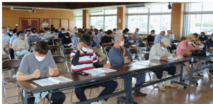
校区協議会の様子（川南）