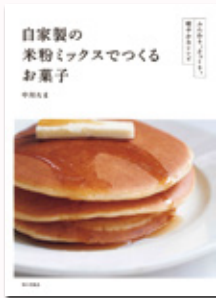
著・中川たま 定価1,650円(税込)