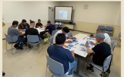
グループワークを行う青年部員

2日目は「道の駅なんごう」にて市場視察を行いました。同道の駅では農家からの委託販売形式で主に果実類を取り扱っており、他市場では規格外になる商品を買取り、加工などして安く販売しています。また、フィンガーライムやミラクルフルーツなど珍しい商品も並んでいました。