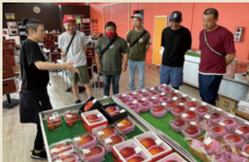
説明を受ける青年部員

参加した青年部員は「青年部として問題は明確でも、対策が分からないこともある。研修で出た意見を共有し、解決に向けて活動に取り組みたい」と話しました。