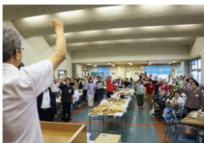
ジャンケン大会に賑わう会場

7月1日、川南町漁協において川南の四季を食べる会が3年ぶりに開催され、100名を超える来場者が絶品料理に舌鼓をうちました。これは平成18年から、川南町の漁業者と農業者の親交を深めるため、季節ごとに地元どれの魚や肉、野菜を使った自慢の料理も持ち寄って会食したことから始まり、年4回行われています。