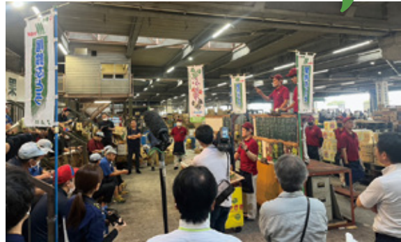
サニールの初競りが行われる市場

荷が出来るよう管理を徹底していきたい」と話されました。また、翌6日には宮崎中央卸売市場で初競りにかかり、2kg箱で1万5000円と、昨年の最高値より6000円高く取引されました。尾鈴が生産する「みやざきぶどうサニールージュ」は県のブランド認定を受けており、同専門部15名が2.2haで栽培。7月中旬に出荷最盛期を迎え、5年度は約9tの出荷を目指します。宮崎県をはじめ、主に九州管内で販売されます。