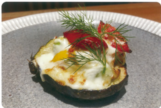
賀茂なすのグラタン