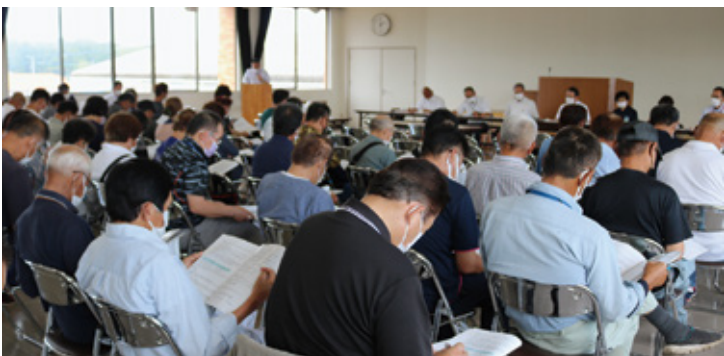
校区協議会の様子（都農）

J A尾鈴では、10月の総会に向けて、7月には組合員説明会を昼・夜の部で開き、9月には地区別座談会にて最終の協議を行い、組合員の皆様のご理解を求めていくこととしています。