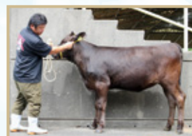
永友雅彦さん「はね21」号