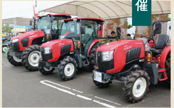
展示される大小様々な農機