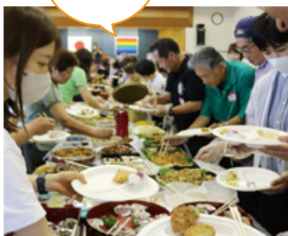
季節感溢れる料理が満載