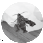
↑ ホシヒメホウジャク

※記事に対する要望・意見等は 2315042まで。 世の中には色々な生き物があるもんだと思ったところでした。