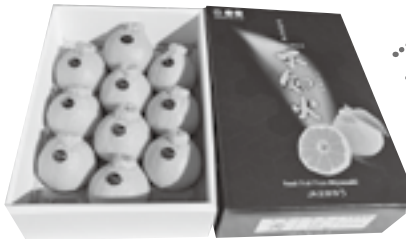
▼ 化粧箱に入った不知火

11月下旬、年末年始の贈答用として人気の高い「ハウス不知火」の収穫が始まりました。