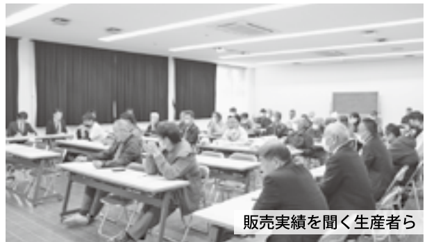
販売実績を聞く生産者ら

11月27日、令和5年産極早生みかん生産・販売反省会が本所研修会館で開催されました。令和5年産については、8月以降の天候不順により糖度は低かったものの、酸切れはよく食べやすい果実に仕上がりに、約1,400t出荷し販売高358,344千円となりました。