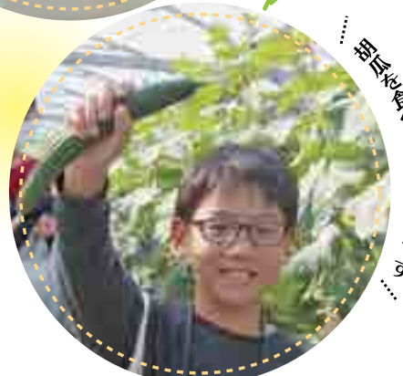
巨大胡瓜ののが楽しみました