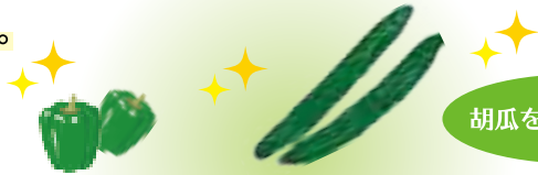
胡瓜を収穫する様子