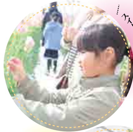
スイートピー収穫したよ

子供たちは、各現場で栽培に関する事や管理、美味しい食べ方などを質問し、農産物に対する理解を深めました。