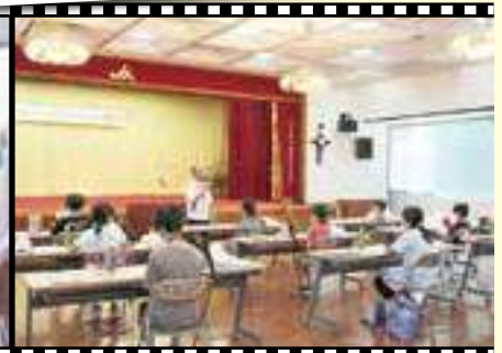
／オリエンテーションの様子＼