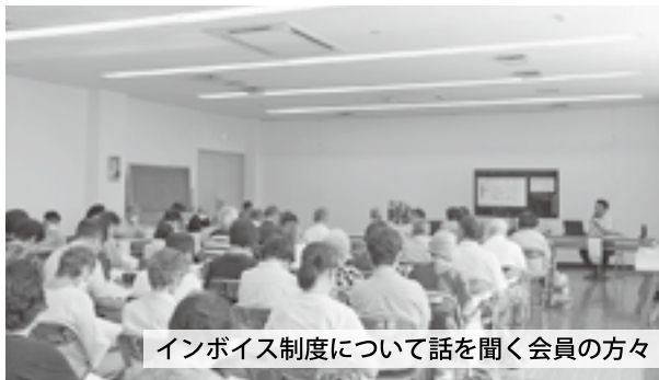
インボイス制度について話を聞く会員の方々

9月25日、本所研修会館にて令和4年度アグリショップ「とれたて会」総会が開催され会員60名が出席しました。議事では令和4年度活動報告及び収支決算の承認が行われ全3議案が承認されました。