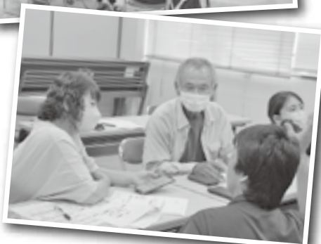
◀実際にアプリをダウンロード

花卉部会は繁忙期の労働力確保を目的に本格的に雇用アプリの活用に取り組み始めました。9月27日、部会員を対象に本所営農相談室にて講習会を実施しました。今回活用するアプリはデイワークというもの。デイワークとは、アプリを通じて1日単位ないし数時間単位で農家と求職者を結びつける仕組みです。講習会では、デイワークアプリの機能説明や利用方法、活用の注意点など実際に使った部会員の意見を交えながら学びました。