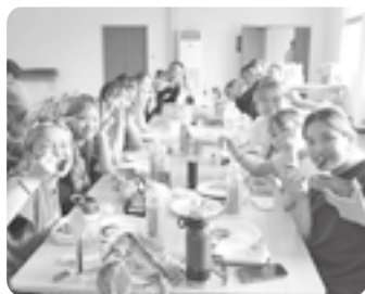
宮崎牛を食べました♡