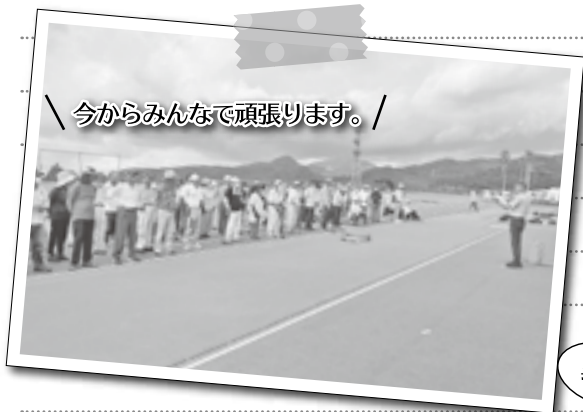
＼今からみんな頑張ります。／