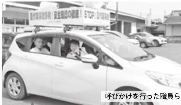
呼びかけを行った職員ら