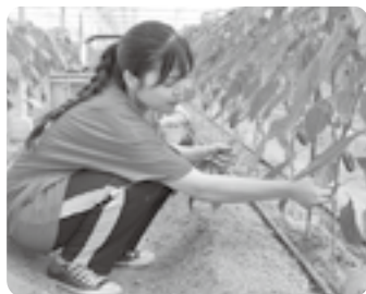
ピーマンの下葉取り作業