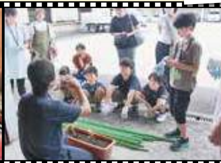
／指導員の話熱心に聞きます＼