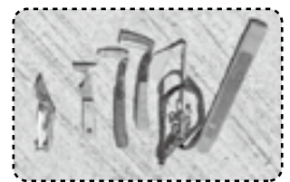
削蹄に使う道具です ▲