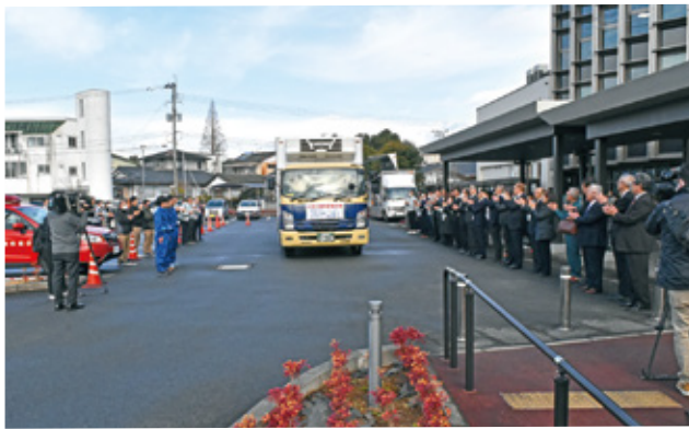
支援物資を乗せたトラックの出発