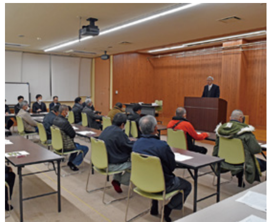
寺師組合長あいさつの様子