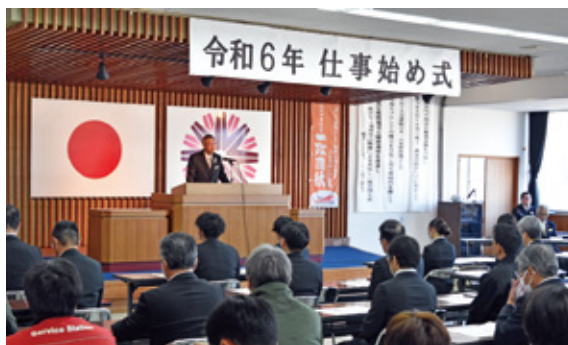
寺師組合長あいさつの様子

本年も決意新たに、組合員・地域住民からのご理解とご協力を得ながら、対話を大切にし、組合員の『声』に基づく運営を徹底し、『持続可能な地域農業を支えるJAこばやし・JAみやざき』の構築に向け、職員一丸となって邁進してまいります。