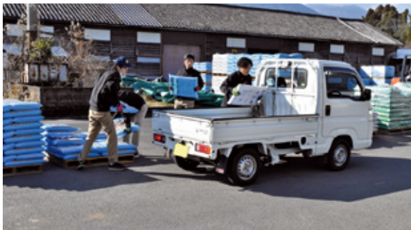
BB肥料・消石灰フェア本所の様子