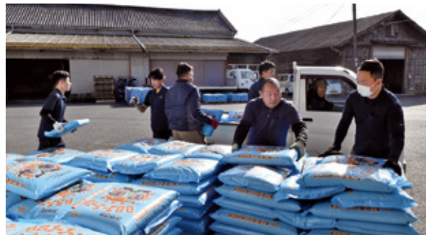
BB肥料・消石灰フェア高原支所の様子

1月23日、乾牧草（オーツヘイ・ルーサン・スーダン）フェアをJA本所で開催しました。