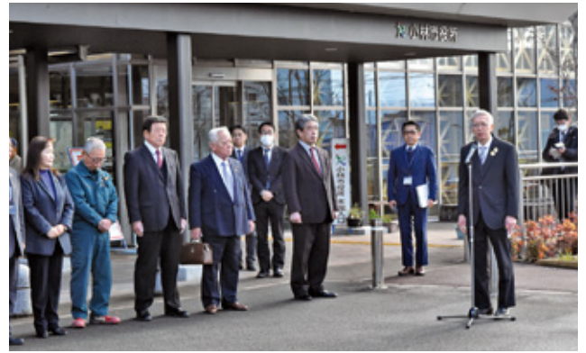
支援団体代表あいさつをする寺師組合長