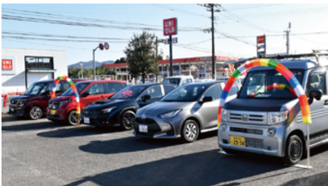
多くの展示車が並びました

1月13日・14日の2日間オートパルこばやしにて、ディーラー7社の協賛により新車・中古車の新春初売フェアを開催しました。