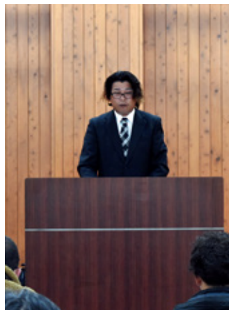
川野会長あいさつの様子