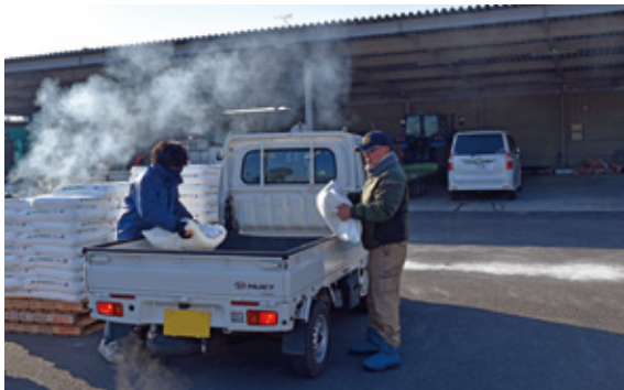
酪農事務所での配布

地域経済の基幹産業である畜産業に係わる家畜防疫については、農家並びに行政・JA等が一体となった地域防疫が必要となるため、今後も継続した支援を行ってまいります。