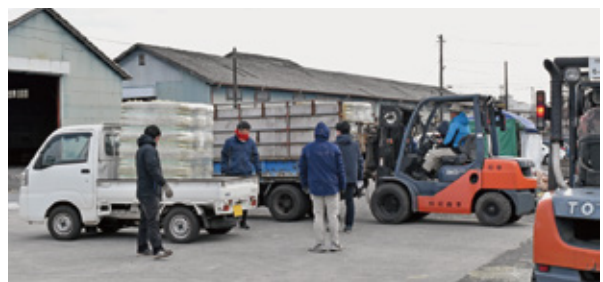
乾牧草フェアの様子