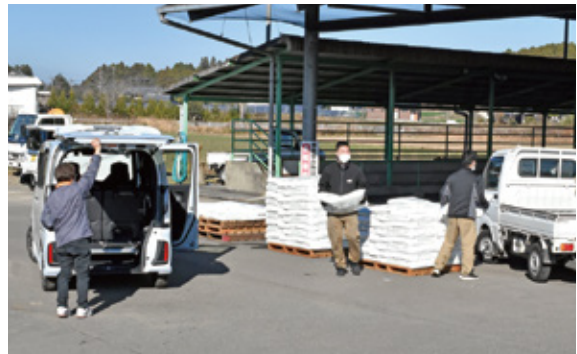
出口振興センターでの配布