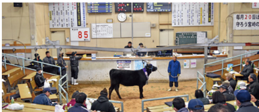
1月期子牛セリ市風景

※東・西・北・須木、三ヶ野山・紙屋の窓口は土・日・祝は休業となりますので上記窓口をご利用ください。