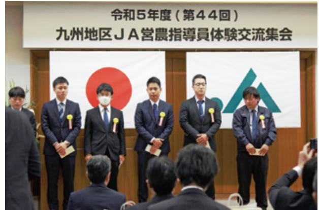
右から2番目が高佐職員