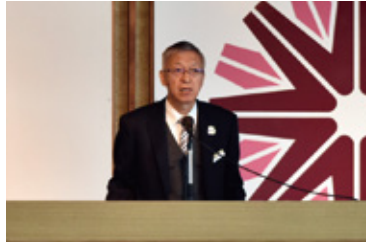
寺師組合長によるあいさつ