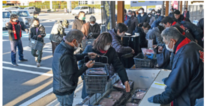
宮崎牛フェアの様子