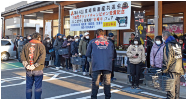
山口課長より県共進会受賞牛について説明がありました

また、牛肉をお買い上げいただいた方には、バターのプレゼントもあり皆さん大変喜ばれていました。