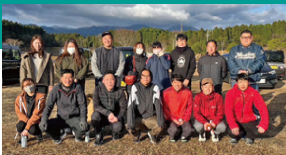
駅伝に参加したJA職員