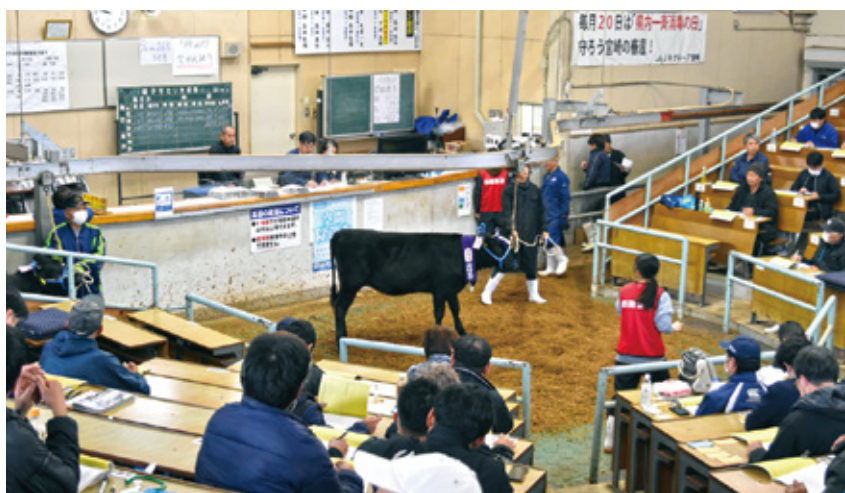
12月期子牛セリ市風景