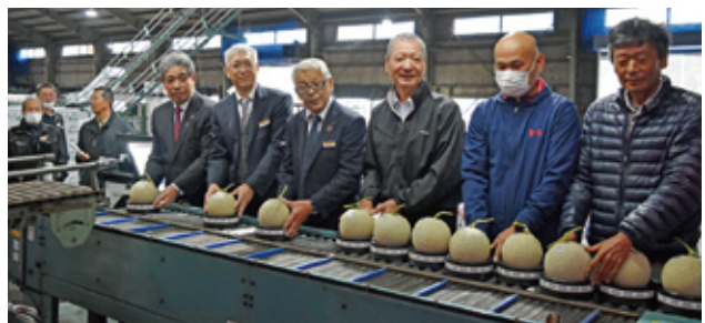
メロン選果機リニューアル稼働式の様子