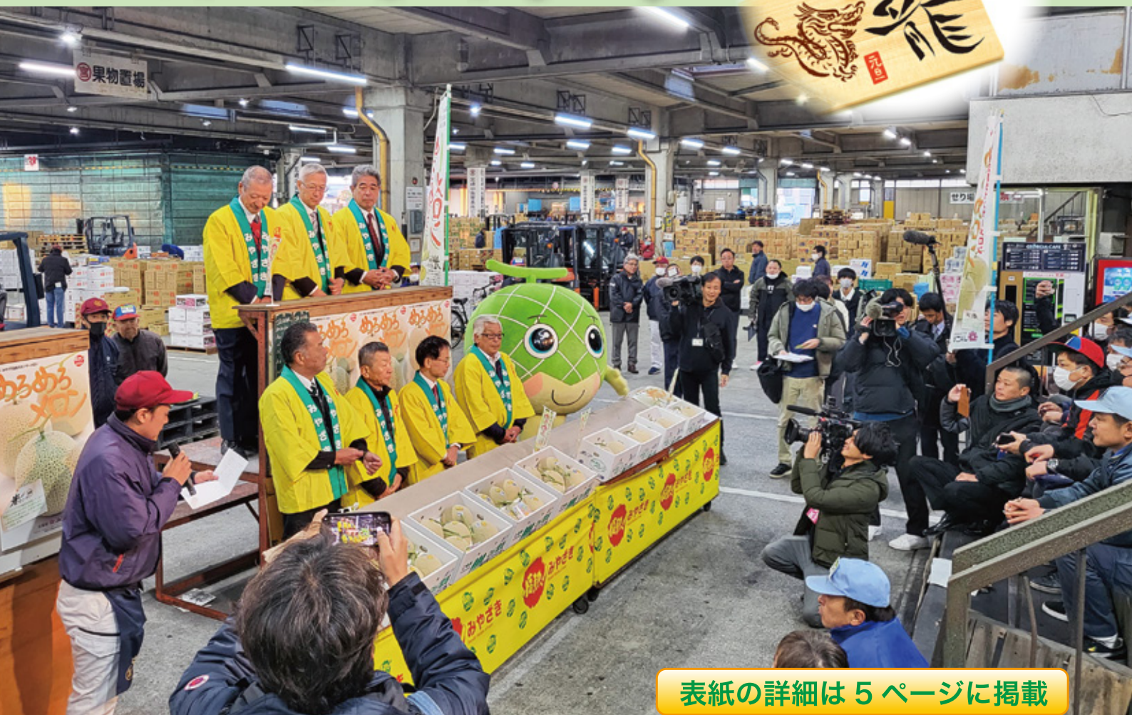
表紙の詳細は 5 ページに掲載