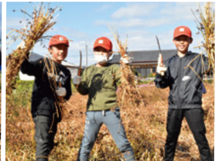
そば収穫体験の様子