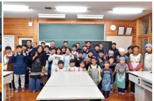
そば打ちに参加された皆さま