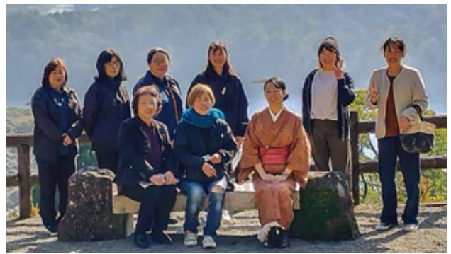
フレミズ県南地区研修会集合写真

研修では、小林市・高原町の史跡巡りとして神社巡りを行いその後、JAこばやし女性部の手作りのお弁当を頂きました。