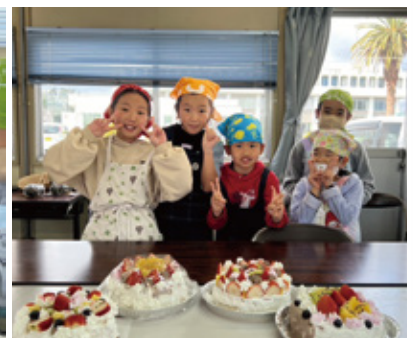
ケーキ作りの様子