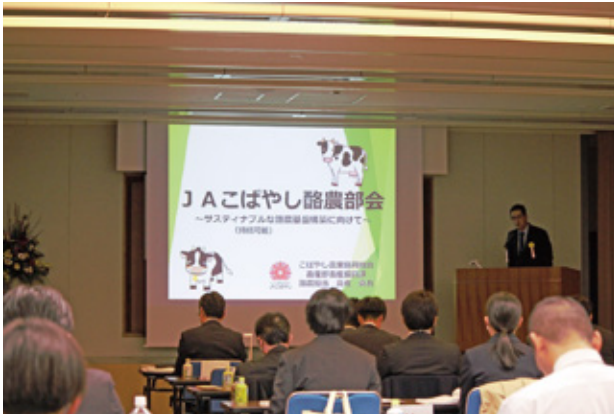
高佐職員による発表の様子