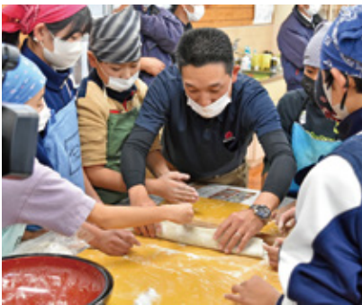
そば打ち体験の様子

放送内容をご覧になりたい方は、UMKのホームページよりご覧になれますので、是非ご覧ください。