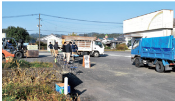
積み込み作業の様子