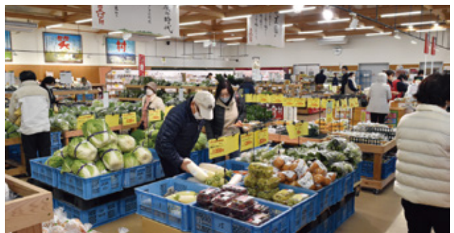
秋の収穫祭中の店内の様子