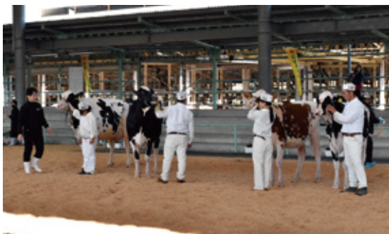
グランドチャンピオン決定検査の様子