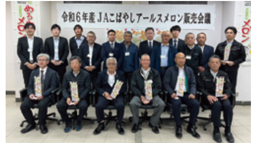
会議に参加された方々