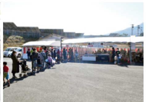
長い行列が出来た焼肉コーナー