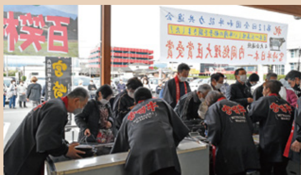
過去の宮崎牛フェアの様子