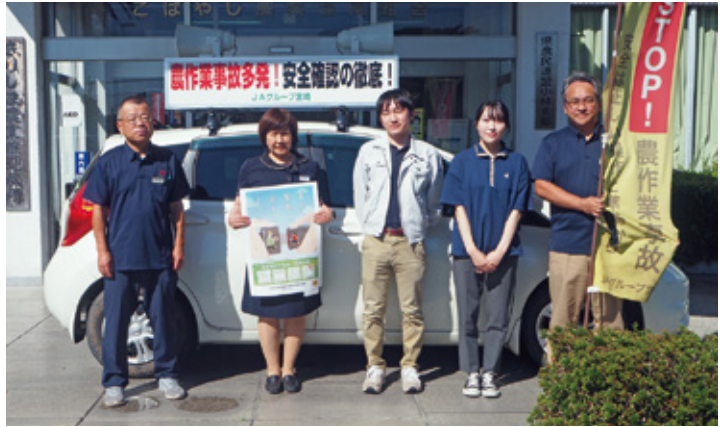
キャラバン隊出発の様子