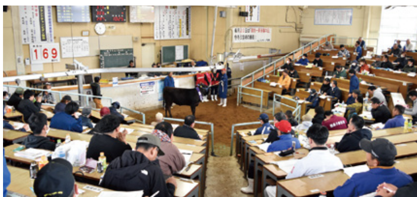
11月期子牛セリ市風景 (単位：頭、円)

《JA共済事故受付センター》 365日 24時間対応 フリーダイヤル ☎0120-258-931