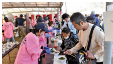
宮崎牛汁うどん販売の様子