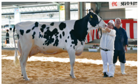
グランドチャンピオンに輝いた合同会社石山牧場さん