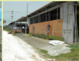
畜舎入口への石灰散布