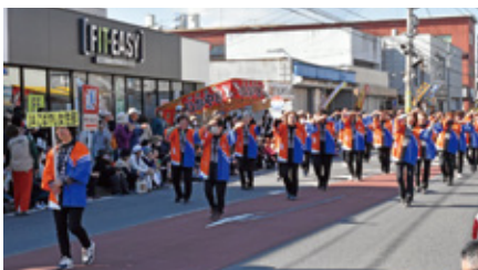
女性部による総踊りの様子

駅前の中央ふれあい広場では、宮崎牛のサイコロステーキや牛汁うどんの販売、ティーパックのつかみ取りなど多くの人で大盛況でした。