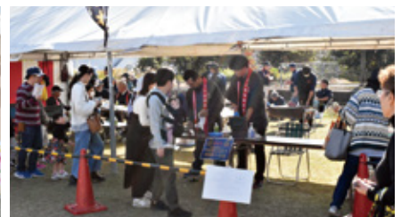
宮崎牛サイコロステーキの販売の様子