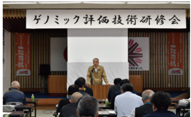
寺師組合長あいさつ