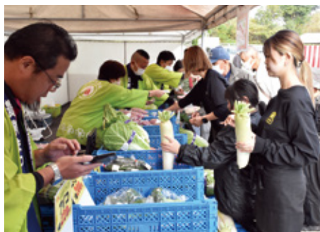
多くのお客様で賑わった野菜即売会