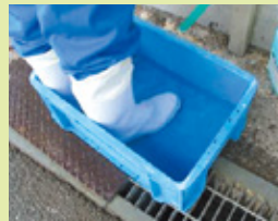
踏み込み消毒槽の設置

畜産農家の皆さんは、飼養衛生管理基準を守って頂くとともに、畜舎内の衛生管理を点検し、一斉に畜舎等の消毒を行いましょう。