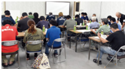
酪農座談会の様子

座談会では、令和5年度酪農対策奨励事業についてなどの説明の後、BL・BVD対策についての研修を行いました。