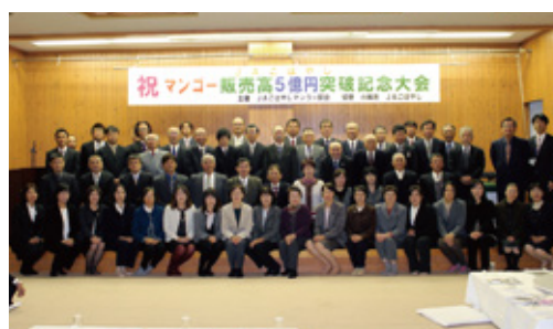
26年12月 495号 JAこばやしマンゴー部会 販売高5億円達成！