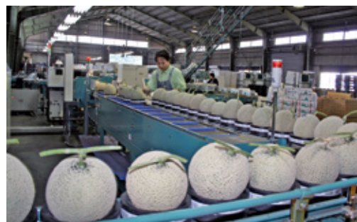
20年6月 417号 みやざき温室光センサーメロン 県下で初めて光センサー非破壊選果機を導入