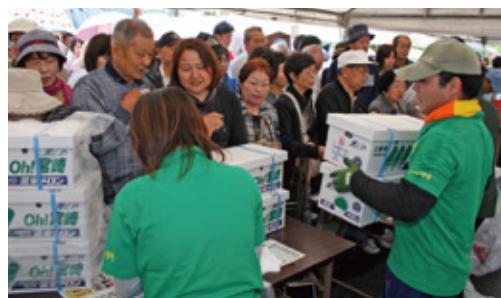
24年7月 466号 第1回こばやしメロン・マンゴーフェア