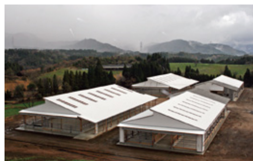
20年5月 416号 小林市、高原町、野尻町に念願の 肉用牛生産団地完成