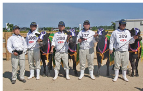
19年11月 410号 第9回全国和牛能力共進会で代表牛9頭 すべて優等賞受賞の快挙