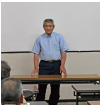
邊木園部会長あいさつ