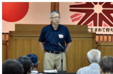
寺師組合長のあいさつ