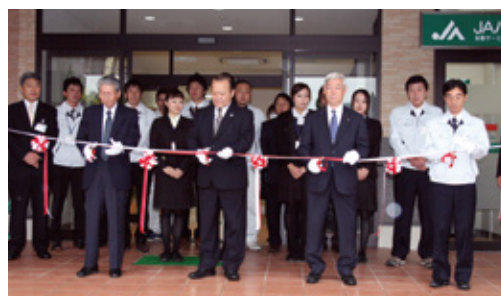
22年12月 447号 新北支所・北給油所 (SS) オープン