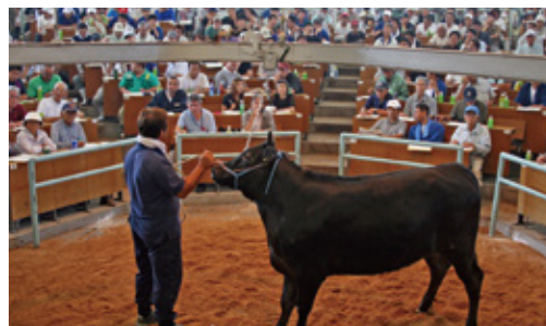
22年9月 444号 口蹄疫終息 西諸畜連子牛セリ市再開される！！