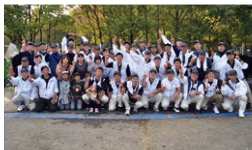
24年11月 470号 第10回全国和牛能力共進会 宮崎牛2連覇達成 種牛群のメンバー