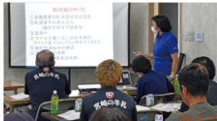
BL・BVD対策についての研修の様子