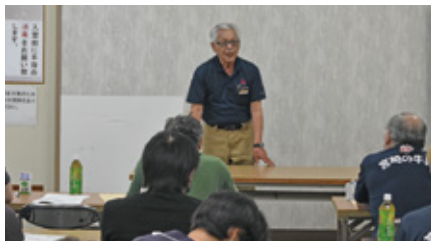
寺前副組合長のあいさつ