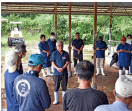
あいさつをする寺前副組合長

当日は、22頭の妊娠牛が出品され、参加者はその場でお気に入りの牛に応募し、応募者が複数の場合は厳正なる抽選により購買者を決定しました。次回は11月に譲渡会を開催予定ですのでぜひご参加ください。