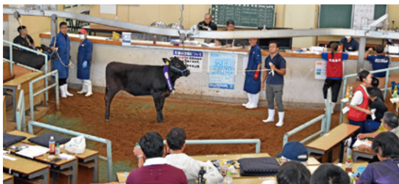
8月期子牛セリ市風景 (単位：頭、円)