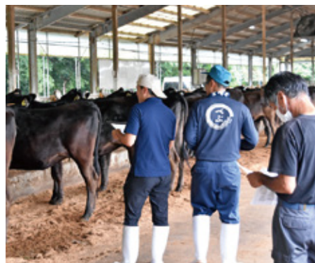
念入りに出品牛の確認をする参加者