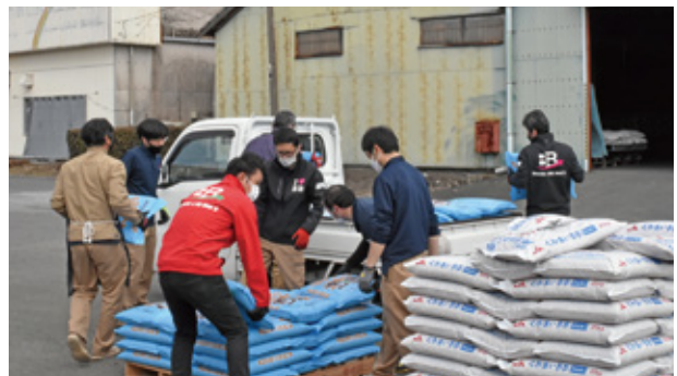
職員による積み込みの様子