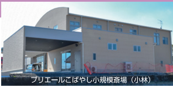
プリエールこばやし小規模斎場（小林）