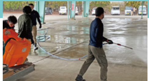
展示会会場の清掃・消毒をする職員