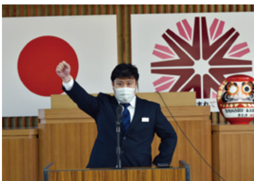
頑張ろう三唱を行う八重尾