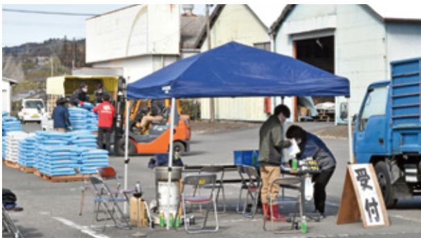
特別フェア受付の様子

同フェアは、肥料価格高騰を受け、農家経営支援と農業生産性向上に向けた仕組みづくりとして、良質な生産資材を大量仕入れし低コストでの供給を目的に、特別価格で販売するものです。434名の皆様にBBゴーゴーマル15,158袋（同期対比95%）、BB新追肥1号5,034袋（同期対比92%）、消石灰548袋（同期対比75%）合計の20,740袋（同期対比93.5%）の予約注文をいただきました。次回は7月中旬に同フェアを予定しておりますので、ご利用下さいますよう宜しくお願い致します。