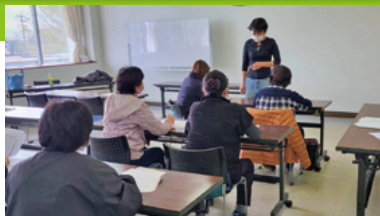
スマホ教室の様子