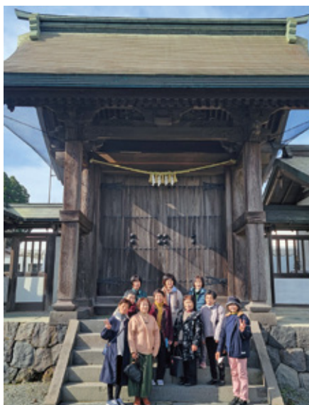
女性部運営委員の皆さん

熊本県阿蘇市を中心に「平成28年熊本地震」の復興現状を視察しました。本部長は「崩落した阿蘇大橋と、新しく開通した新阿蘇大橋を順に見て人の力の凄さを感じました」と話しておられました。