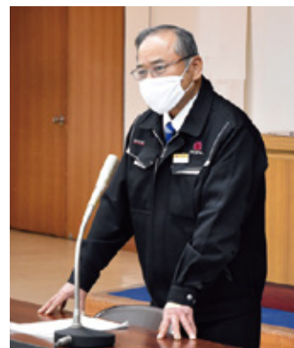
意見・要望に回答される入佐組合長