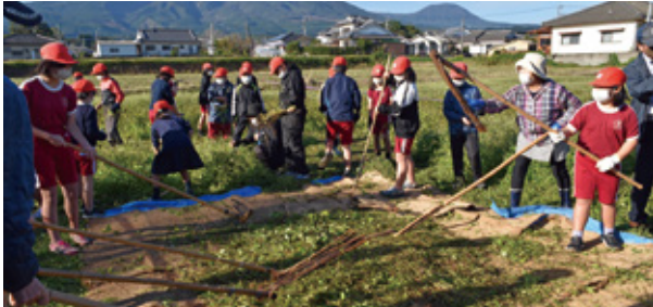
めぐり棒を体験する様子