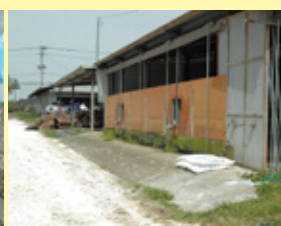
畜舎入口への石灰散布