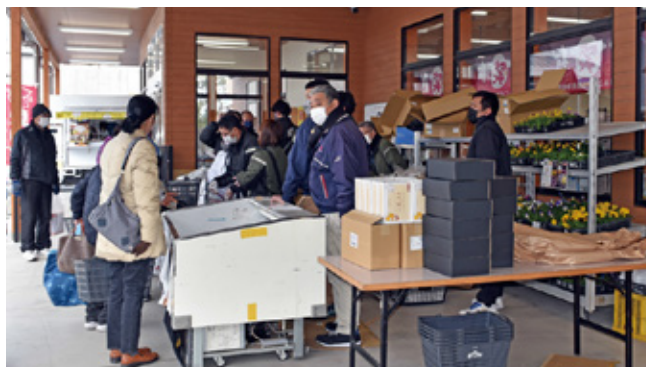
宮崎牛フェアの様子