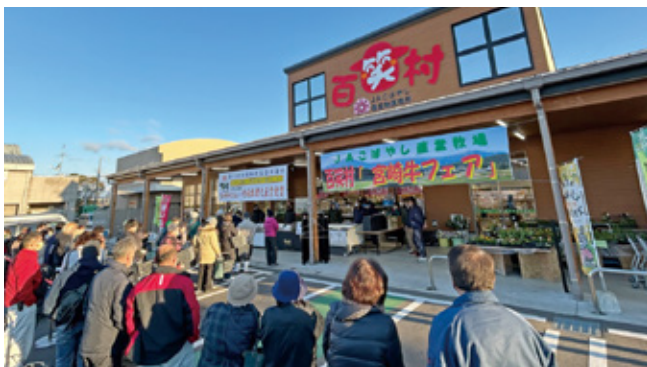
開店前の大行列の様子