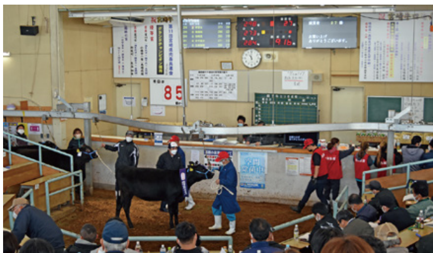
12月期子牛セリ市風景