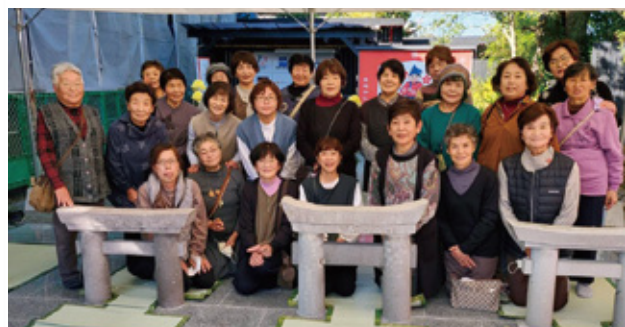
須木支部の皆さん