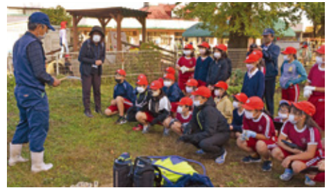
営農組合員からの指導の様子

刈り取ったそばをめぐり棒を使っての脱穀をした後、唐箕（とうみ）を使って風を起こし、そばの実と塵（ちり）を選別する体験をしました。