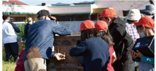
唐箕（とうみ）を体験する様子