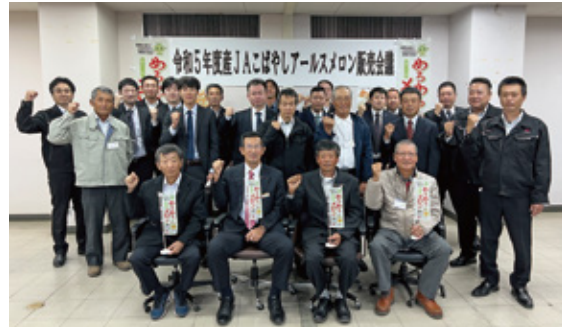
販売会議に出席された方々