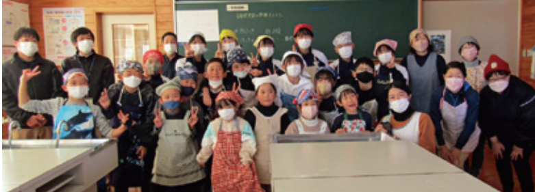
そば作り体験をした児童達

JAこばやし北支所(坂元誠支所長)は「1支所1協同活動」として、「そば打ちの体験学習」を行いました。この活動は園児から大人までの地域住民、JA役職員・青年部・女性部・営農組合が1つの目的をもって活動し、お互い親しみやすい身近な仲間づくりと、子供から大人まで一緒に取り組む食農教育を目的としています。体験学習では、永久津保育園園児、永久津小・中学生、JA役職員、女性部30名の参加がありました。子供たちは「自分たちが植えたそばは、台風の影響で収穫ができなかったけど、そば打ちの体験ができてとても楽しかった」と喜んでいました。