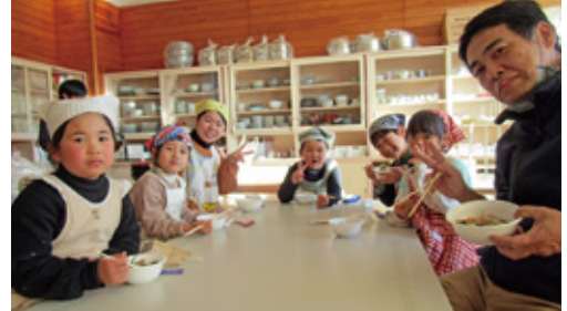
おいしくいただきました。