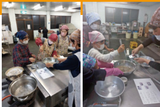
コンニャク作りの様子