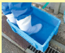
踏み込み消毒槽の設置

畜産農家の皆さんは、飼養衛生管理基準を守って頂くとともに、畜舎内の衛生管理を点検し、一斉に畜舎等の消毒を行いましょう。