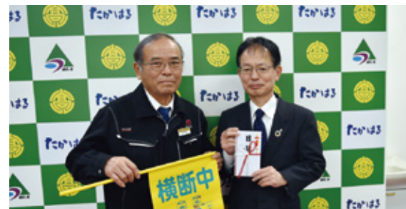
高原町長へ目録贈呈の様子