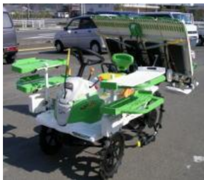
( 前 )