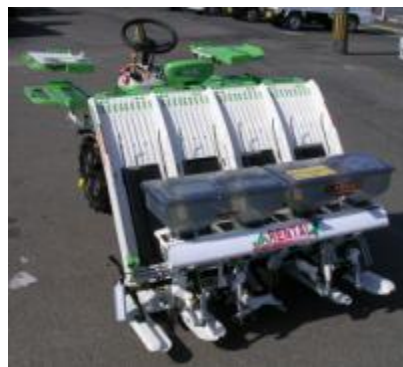
( 後 )