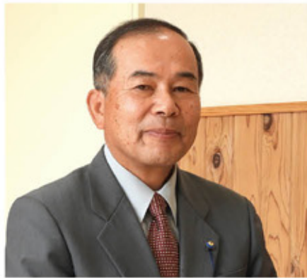
JA日向ひむか米振興協議会