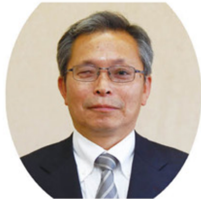
日向農業協同組合

連続3回受賞は大変光栄なことであり、嬉しいことです。中山間地域のヒノヒカリが「おいしいお米」であることの証が3年連続とつながりました。3年連続は大変難しいものです。毎年の自然条件が大きく左右される中での米作り、台風・日照不足・病虫害等があります。様々な事に対応しての受賞はすべての稲作農家にとりまして大きな励みとなります。コロナ禍にあって全てのイベントが中止せざるを得なかった今日、同地域の農家にとっても不自由さを感じつつ誠実に管理調整を行い、美味しいお米づくりが出来たのがこの受賞へと繋がりました。最後にこの米作りにかかわりました皆様方に深く感謝申し上げます。