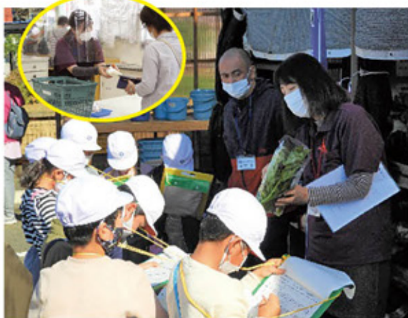
▲地域の小学生に農産物を紹介する職員