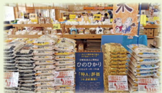
▲八菜館店内の様子