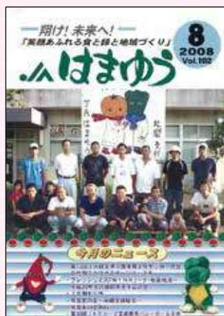
2008年8月号 吾田小児童みかん狩り体験