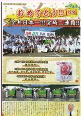
2012年号外 長崎全共 内閣総理大臣賞獲得!!