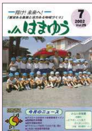
2002年7月号 プリエールはまゆうオープン