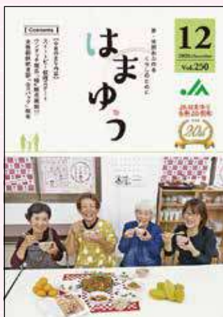
2020年12月号 ワンタッチ胡瓜「極」販売開始