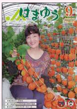
2016年9月号 女性部わくわく スポーツフェスタ開催!