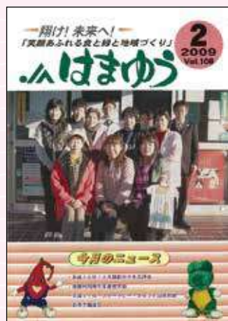
2009年2月号 ふれあい総合展示即売会& 焼肉フェスタ