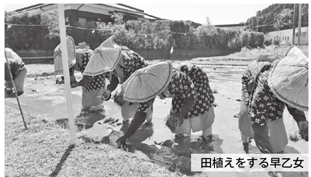
田植えをする早乙女

3月27日、鵜戸神宮御神田で御田植祭が開催され、地主や関係者などが参加し豊作を祈願して玉串を奉奠しました。