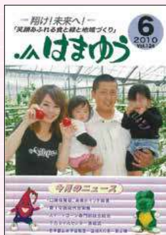
2010年6月号 口蹄疫発生一丸となって防疫対策