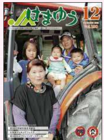
2015年11月号 県畜産共進会 肉牛枝肉の部団体賞獲得!