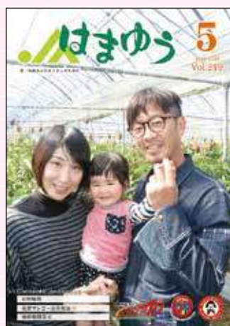
2018年5月号 各支所で1支所1イベント開催