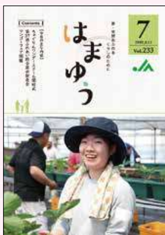
2019年7月号 青年部 食と農をキビリ隊活動開催