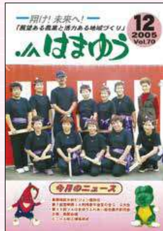
2005年8月号 甘藷出発式 年間2700tに向けて