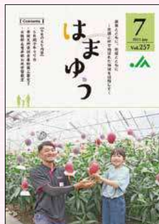
2021年7月号 スイートピーの花束エール 中学生にプレゼント