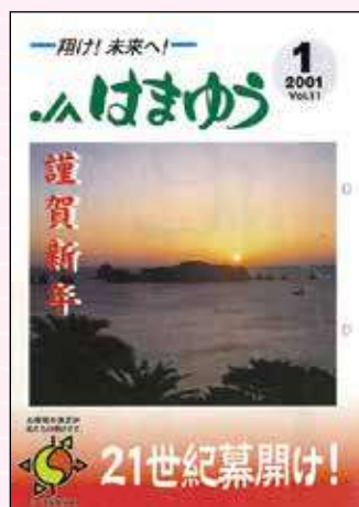
2001年1月号 狂牛病対策に奮起