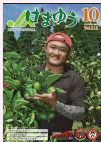
2017年10月号 宮城全共「日本一の努力と準備」 チーム南那珂快挙!!