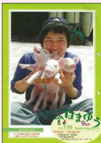
2011年9月号 TPP 反対運動