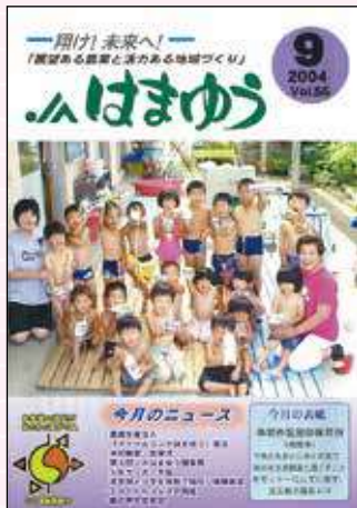
2004年9月号 ドリームランドはまゆう設立

今回、JA はまゆうのこれまでのあゆみを広報誌の表紙と共に簡単ですが、振り返ってきたいと思います。