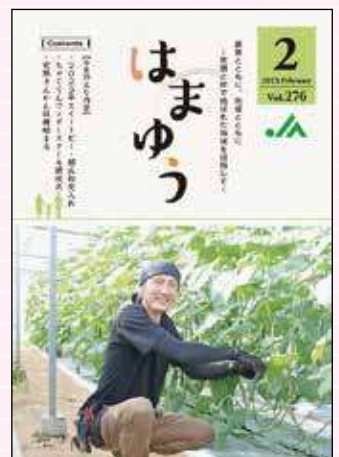
2023年2月号 県共進会 肉豚枝肉の部団体優勝