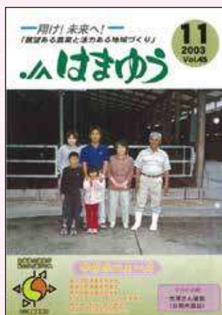
2003年11月号 マルチ日南一号が 宮崎ブランド承認