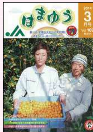
2014年3月号 青年部夏季対話集会開催