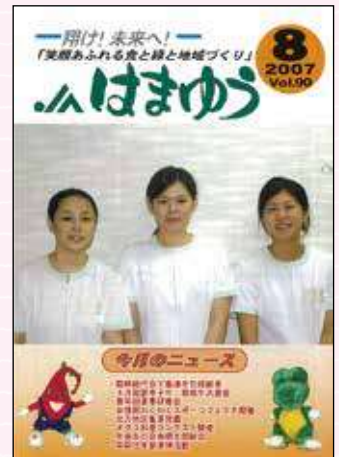
2007年8月号 畜連包括承継