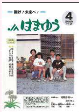
2000年4月号 新JA はまゆう設立

2000年に「JA はまゆう」が誕生し、組合員や地域の皆様とともに長い歴史を歩んで参りました。そこで