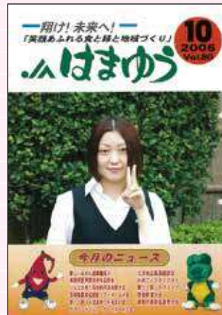
2006年10月号 堆肥センター竣工・祝賀会