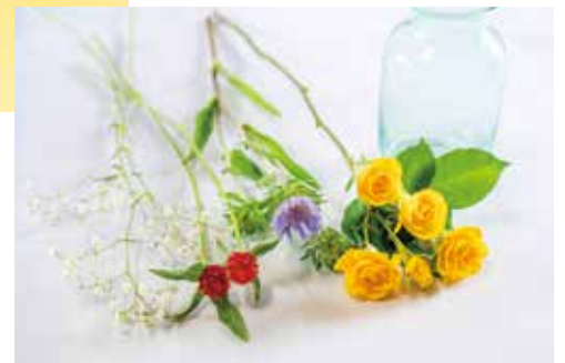
花材（左から） ・カスミソウ ・千日紅 ・ストケシア ・バラ

残りは差し色で間に入れていき、最後にカスミソウでバランスをとって完成です。投げ入れに細かなルールはありません。ぜひ好きなように楽しんでください☆