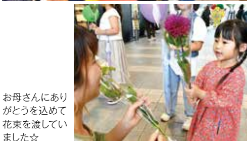
お母さんにありがとうを込めて花束を渡していました☆