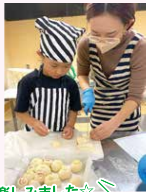
親子で体験を楽しみました☆