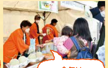
今年は 試食販売も 行えました☆