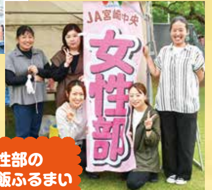
女性部の 赤飯ふるまい