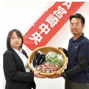
6月8日宮崎営農センターにて