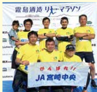
霧島酒造リレーマラソン

揃いの黄色いTシャツでJA宮崎中央をPR! どちらの大会においてもチーム一丸となって走りぬぎました。今後、地元大会に出場し、一緒に大会を盛り上げますので、何かの大会で見かけた方はぜひ声援をお願いします。