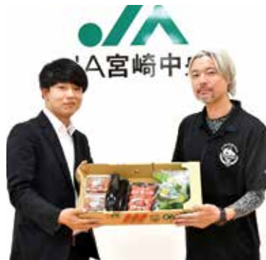
5月11日国富支店にて