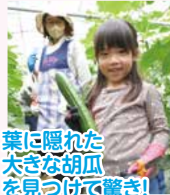
葉に隠れた大きな胡瓜を見つけ驚き!