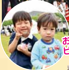
おもちとれたよ！ ピース!!