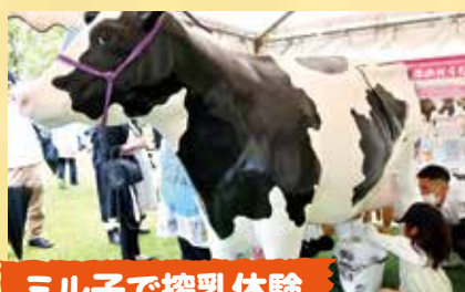
ミル子で搾乳体験