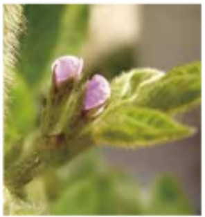
種まきから50日ほどで薄紫色の愛らしい花が咲きます。10月初旬から11月初旬にかけて収穫時期を迎えます。

大豆は日本では弥生時代ごろから栽培されていたと考えられています。瘦せ地でも育ち、日本全国の風土も選びません。豆として食べるだけでなく、古くから親しまれている納豆、豆腐、油揚げ、きな粉、豆乳、湯葉など……。若い実をエダマメとしても食べますし、豆もやしもおいしいです。