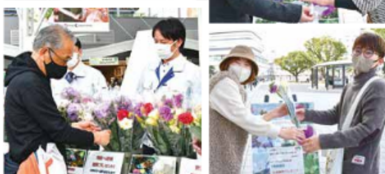
いろんな花から贈る相手を想って選びます