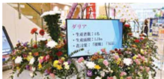
花卉連絡協議会の装飾展示

2月4～5日、イオンモール宮崎で花の祭典2023が開催されました。会場内では特設ステージでのフラワーファッションショーや通路にはフラワーデザインコンテストの作品が展示されたりと色とりどりの花が溢れる会場となりました。