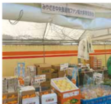
キャンプ販売ブース

これらの販売を通して、JA宮崎中央産農産物のファン拡大、地産地消活動を行いました。