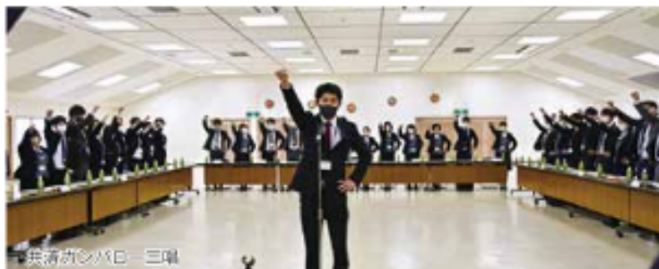
共済会のバドミントン