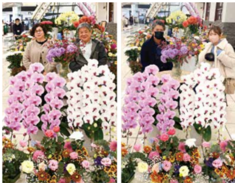
来場者の方に記念に撮影させていただきました!