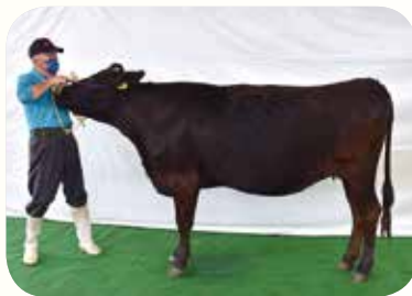
松山 道明さん（田野） 「ちかこ」号（H29.10.25）