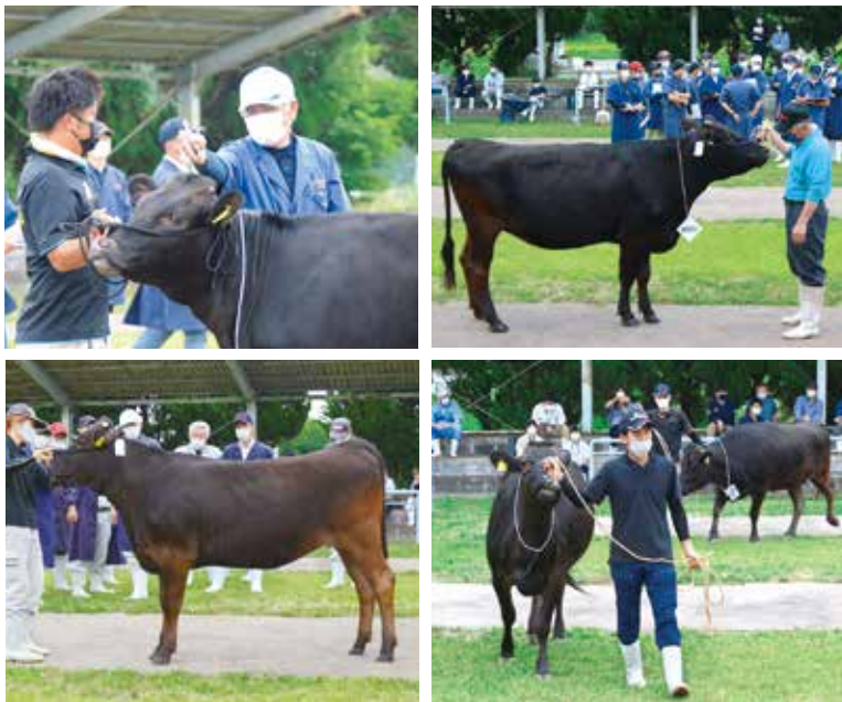
牛の綺麗な立たせ方はとても重要！ 歩き方も大切！

6月1日、第12回全国和牛能力共進会に向けた地域代表牛決定検査会を行い、宮崎中央支所代表牛が決定いたしました。計13頭が8月に行われる宮崎県代表牛決定検査会に出場します。