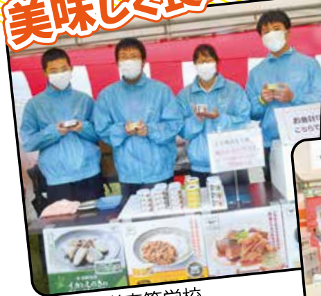
宮崎海洋高等学校