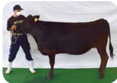
長友 明さん（宮崎） 「よこ6の6」号（H30.2.15）