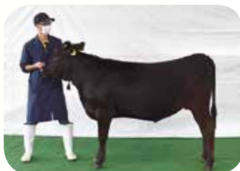
宮崎繁殖センター(宮崎) 「ひかる1233」号(R3.4.12)