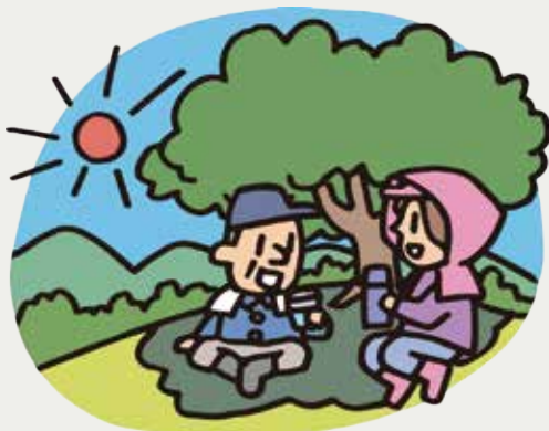
イラスト：服部新一郎

2021年から全国で発表されています。当日、翌日の暑さ指数が33以上になると予想されるとき発表されます。暑さ指数は、気温だけでなく湿度や日射などの要素も入れて計算されるため、熱中症の危険度を表しているといえます。