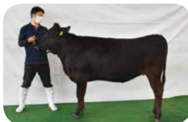
長野 貴寛さん(高岡) 「ふじまつ11」号(R3.1.9)