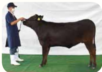
宮崎繁殖センター(宮崎) 「まりあ」号(R3.4.29)