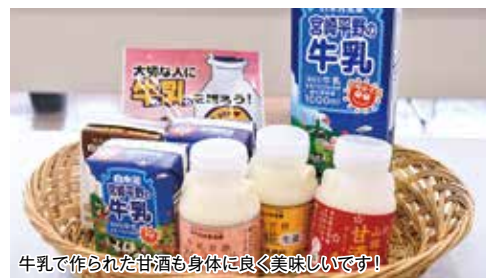
牛乳で作られた甘酒も身体に良く美味しいです!