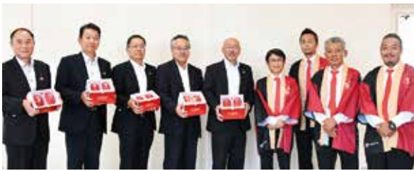
JA本店にて役員との意見交換会も行われました(5月18日)

贈呈式後は今年のマンゴーの出来について報告、宮崎マンゴーのPRをお願いするなど、様々な意見交換も行われました。