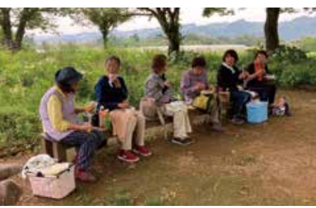
それぞれ持参したお弁当はどれも美味しそうでした！