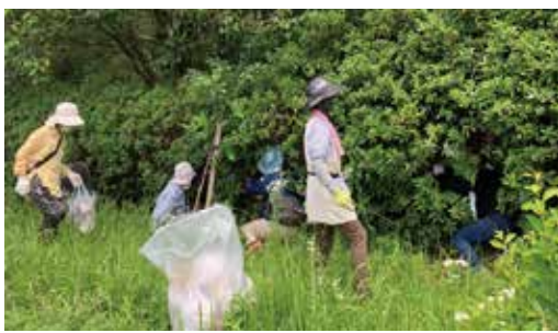
駐車場裏の草むらにはたくさんさんのゴミが落ちていました！