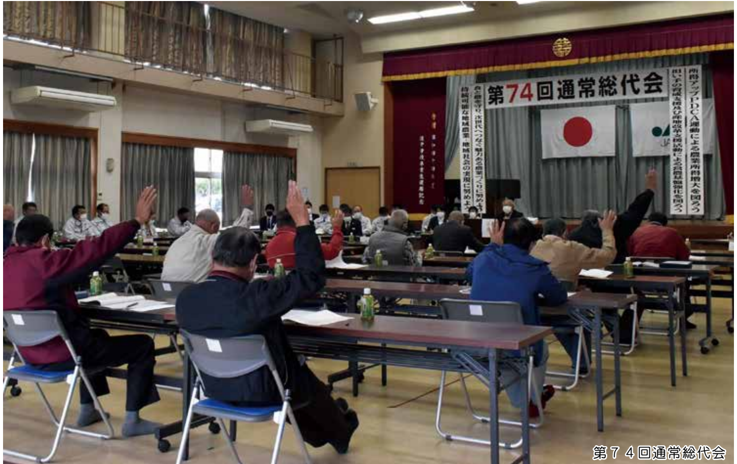
第 7 4 回通常総代会