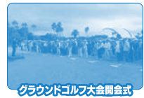
グラウンドゴルフ大会開会式