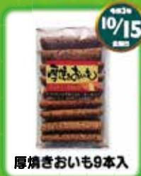
厚焼きおもち9本入