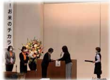
女性協の長倉会長から退任の記念品を受取る有木監事