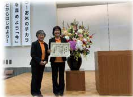
受賞の記念写真(左)有木監事、(右)児玉部長