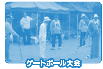
ゲートボール大会