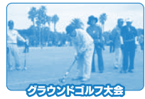
グラウンドゴルフ大会