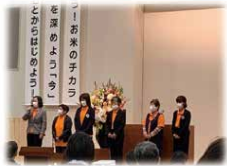
今回退任される県役員の皆様(右から三番目が有木監事)