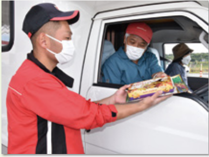
プレゼントにニコリの来店者(松山給油所)