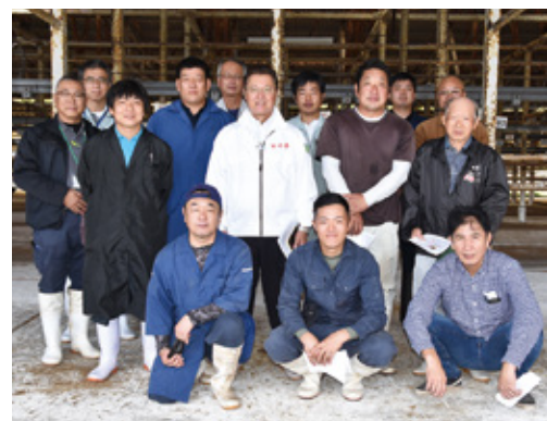
出発式に参加した出品者と関係者

第11回宮崎県肉畜共進会(10月25日、都城市ミヤチク高崎工場)に出品した東臼杵郡市畜連代表牛の出発式は10月21日、櫛津町の延岡家畜市場で行われました。代表5人に対し、同畜連、市役所、JAなどから奨励金が贈られました。