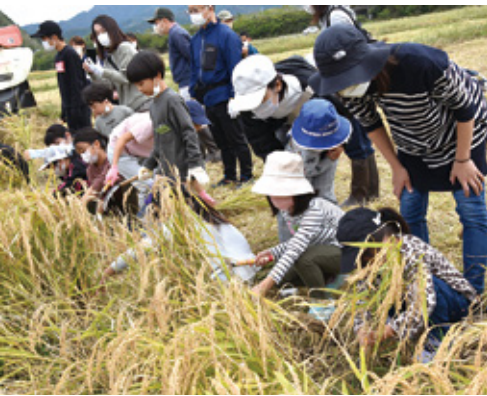
稲を刈り取っていく親子

たちは自然災害にも負けず、心は早くも来年を見据えています。皆さんたちも困難に遭遇しても落ち込まず、何事にも前向きに取り組んでください」と諭しました。