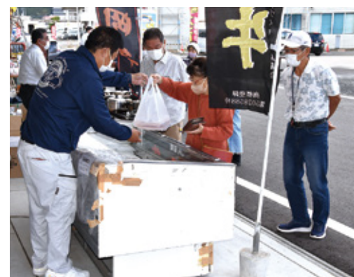
好評だった宮崎牛の販売

新米の季節にふさわしく令和4年延岡産ヒノヒカリを始め有機へルパー万能等の肥料や野菜苗、花苗・種、さらに川原農園の移動販