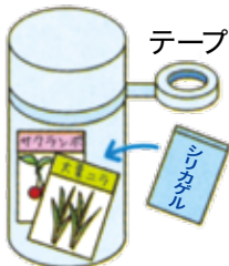
図3 簡易な発芽能力の確認方法