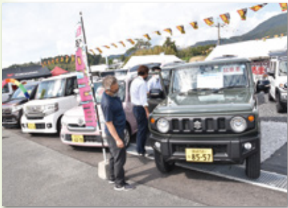
お気に入りの車を探す人たち(自動車展示場)