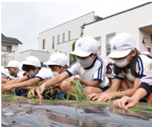
ていねいに苗を植えていく南方小(上)と土々呂小(下)の児童たち