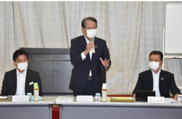
右から楠田組合長、福良会長、池澤次長

意見交換会は随時、県内各JAで開かれており、福良会長は「10月末には全JAから基本合意が得られる見通しだ。合意後はスムーズ