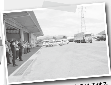
↑トラックを見送る様子