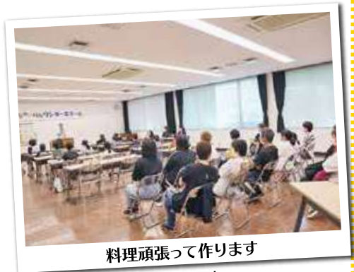
料理頑張ってます

参加した子どもは「上手にできて楽しかった。家でもナポリタン風ごはんを作ってみたい」と笑顔で話しました。