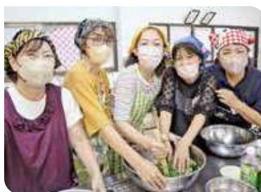
みんなで混ぜ混ぜ