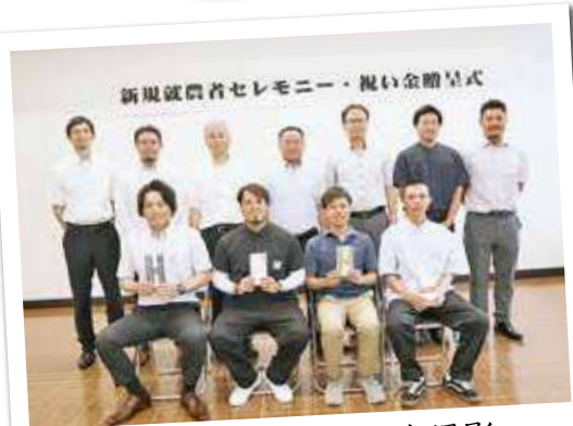
セレモニー後の記念撮影

終了後は、パイオニア研修会を受講し、青年部員と共に協同組合の理念や歴史などを学びました。