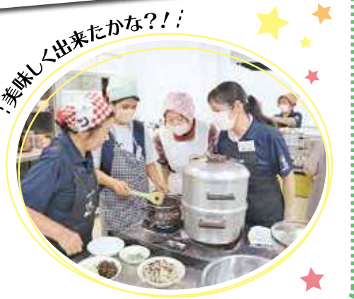
美味しく出来たかな?!!