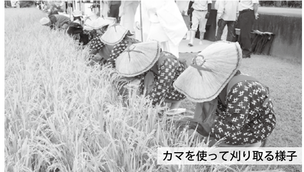
カマを使って刈り取る様子