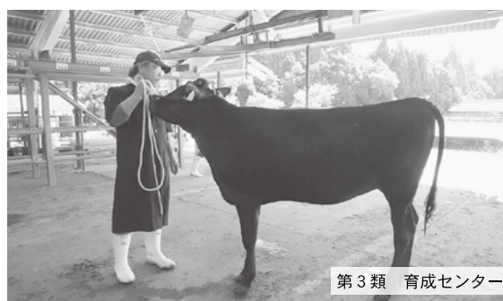
第3類 育成センター