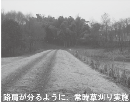
路肩が分るように、常時草刈り実施

転倒、転落による死亡事故の殆どがほ場や農道で発生しており、路肩は危険がいっぱいです。