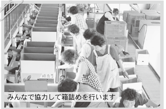
みんなで協力して箱詰めを行います