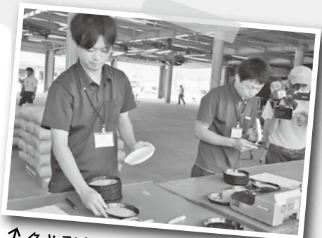
↑色や形などを検査する農産物検査員

7月17日、日南新選果場で令和6年産早期米初検査、出発式を開催し「コシヒカリ」2.8tを検査し、一等米比率が100%の好スタートを切りました。出発式には生産者や行政、関係機関などから約50人が参加。鏡開きや万歳三唱で初出荷を喜ぶとともに、収穫作業の安全や価格の安定を祈願しました。検査された早期米はトラックに積み、参加者らに見送られ関東、関西方面に向けて出発しました。