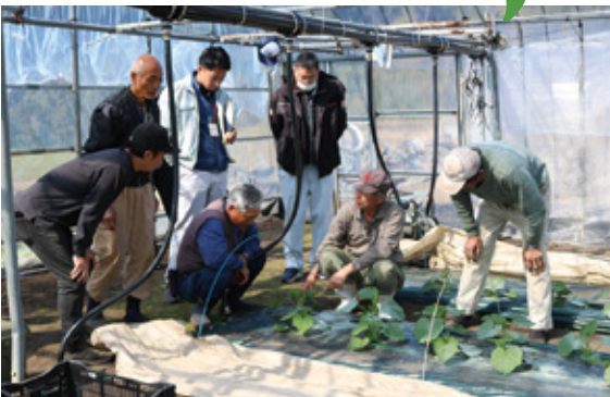
現地検討会の様子

管理し、活着後はトンネル内の十分な換気で、徒長しない丈夫な樹づくりに努めてほしい。交配からの3週間程度が実の肥大期として大事な時期になるため、肥料不足、水分不足、病気等には注意してほしい」と指導がありました。またJA販売課担当からは「現在の販売情勢は沖縄産・外国産の生産量・価格は例年通りで推移しており、尾鈴産は昨年6月の端境期に品物が切れることがあったため、安定的に出荷できるよう市場から要望があった」と販売情勢を報告しました。