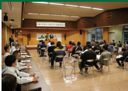
あいさつをする黒木青年部長

6年度より県域JAに伴って部の名称を「JAみやざき尾鈴地区本部青年部」に変更し、「未来へ種を蒔こう～農業っていいもんだ。～」をスローガンに青年部活動を展開していきます。