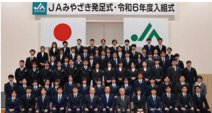
JAみやざき発足式・令和6年度入組式