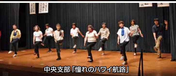
中央支部「憧れのハワイ航路」