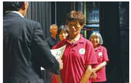
家の光記事活用作品優秀賞 北・東方支部