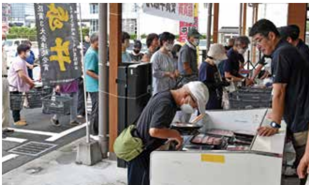
宮崎牛フェアの様子

また、数量限定で牛肉を購入いただいた方に牛乳のプレゼントもあり皆さん喜ばれていました。