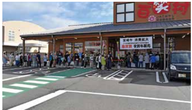
長い行列ができました