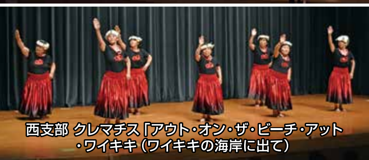
西支部 クレマチス「アウト・オン・ザ・ビーチ・アット ・ワイキキ(ワイキキの海岸に出て)」