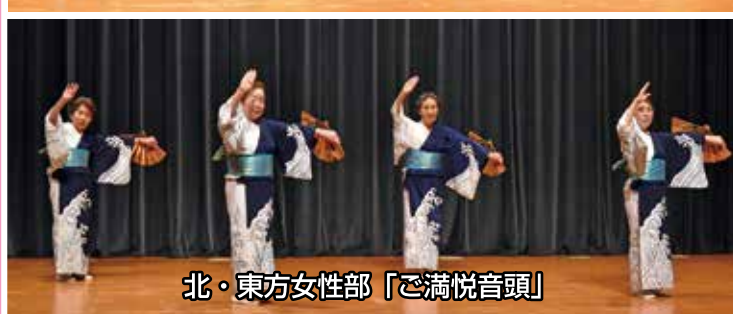
北・東方女性部「ご満悦音頭」