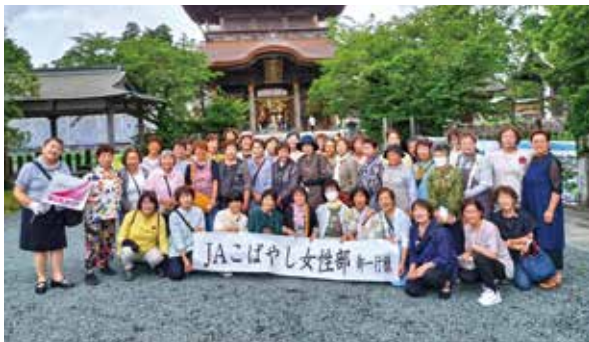
阿蘇神社にて集合写真

参加された部員の方は、「田原坂西南戦争資料館では、ドラマで見た西南戦争についていろいろ知れてよかったです。」と話され、観光や買い物などで旅行を満喫されていました。