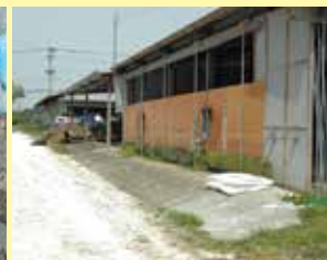
畜舎入口への石灰散布