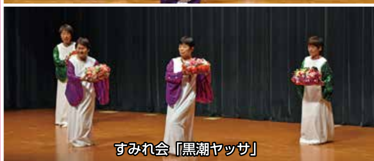
すみれ会「黒潮ヤッサ」