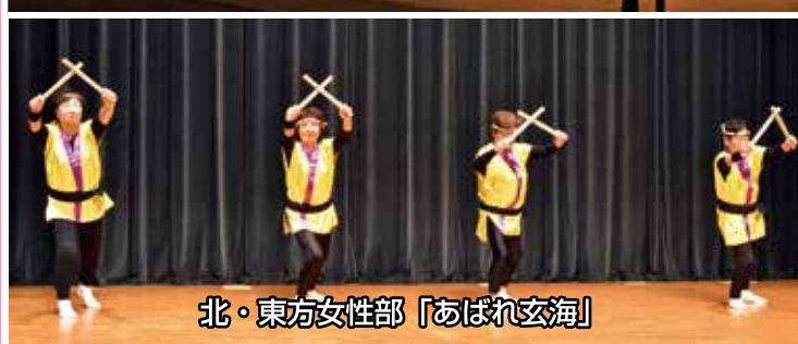
北・東方女性部「あばれ玄海」