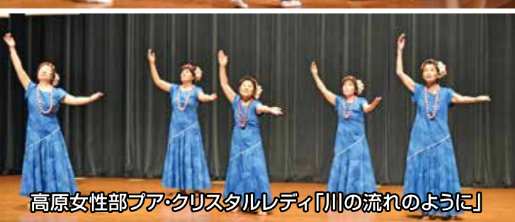
高原女性部プア・クリスタルレディ「川の流れるように」