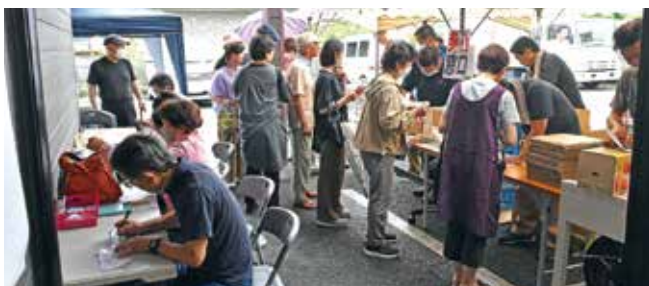
発送手続きをされる方々