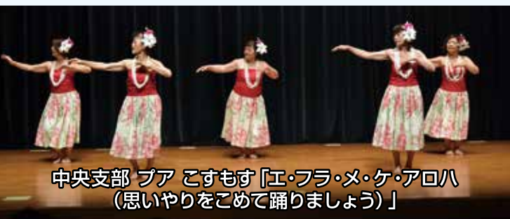
中央支部 プア こすもす「エ・フラ・メ・ケ・アロハ (思いやりをこめて踊りましょう)」