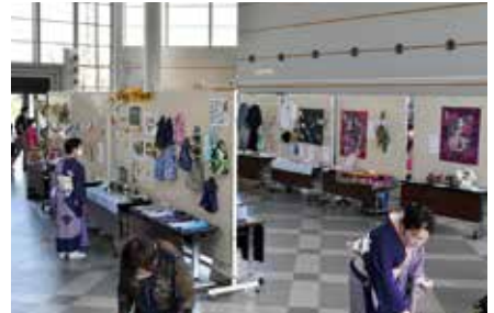
家の光記事活用作品などの展示