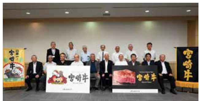
各地区本部の繁殖牛部会長とJAみやざきの役員ら

経済連和牛振興課によると、2024年1月現在、本県の繁殖牛部会員数は4,135人で、会員母牛数は8万1,456頭となっています。