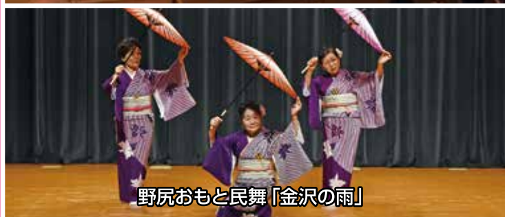
野尻おもと民舞「金沢の雨」