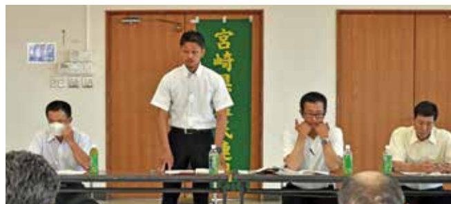
高津佐会長あいさつ