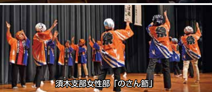
須木支部女性部「のさん節」