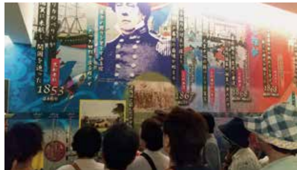
田原坂西南戦争資料館を見学の様子