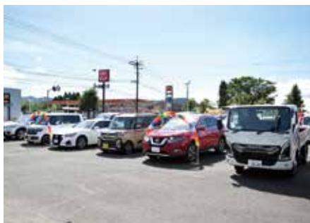
オートパル小林的展示車