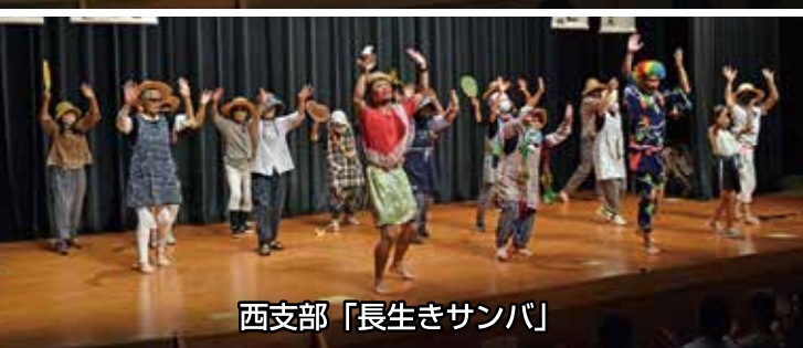
西支部「長生きサンバ」