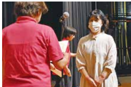
手作り作品優秀賞 西支部手芸クラブ