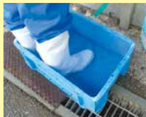
踏み込み消毒槽の設置

畜産農家の皆さんは、飼養衛生管理基準を守って頂くとともに、畜舎内の衛生管理を点検し、一斉に畜舎等の消毒を行いましょう。