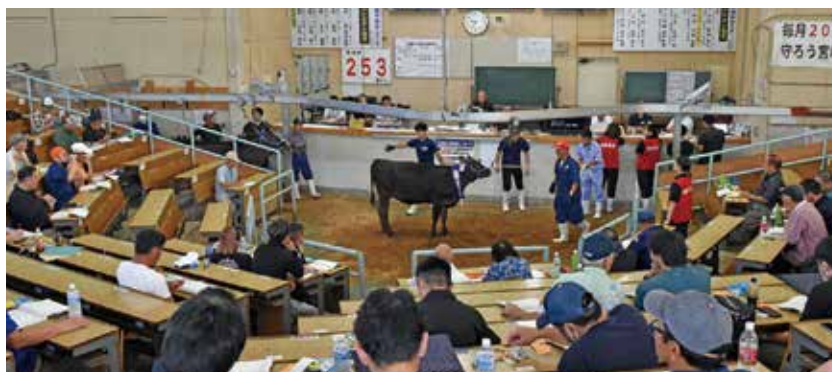
7月期子牛セリ市風景