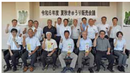
会議参加者での集合写真