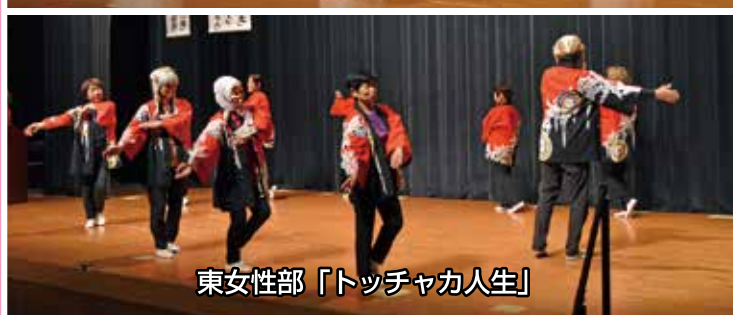
東女性部「トッチャカ人生」