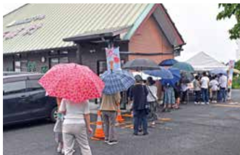
長い行列ができました

百笑村でのフェアなどのイベント情報は、百笑村Instagramでも発信していますのでぜひフォローしてチェックしてみてください。