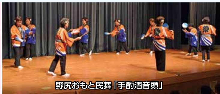
野尻おもと民舞「手酌酒音頭」