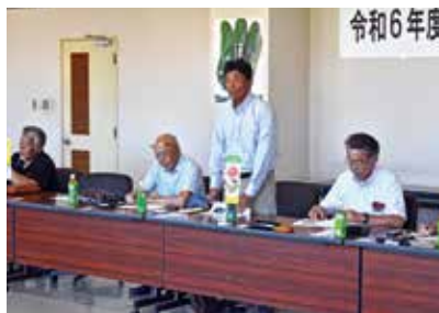
炭床部会長あいさつ

会議では、各市場担当者より情勢報告を頂いたのち、令和6年産夏秋きゅうり出荷計画や、令和6年産夏秋きゅうり栽培出荷・販売取り組みについて協議しました。