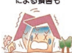
地震による損害も