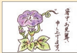
のんびりさん(庄内)