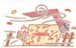
風災・水災・雪災 による損害も