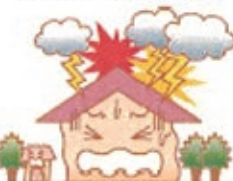
落雷による損害も

共済証書記載の建物内の盗難に限ります。原価額は、通算の場合1回の事故につき30万円または火災共済金額のうちいずれか低い額。盗貯金証書の場合、1回の事故につき300万円または火災共済金額のうちいずれか低い額になります。