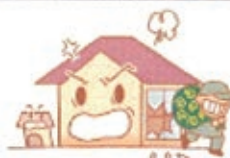
盗難による 現金被害も保障

共済証書記載の建物内の盗難に限ります。原価額は、通算の場合1回の事故につき30万円または火災共済金額のうちいずれか低い額。盗貯金証書の場合、1回の事故につき300万円または火災共済金額のうちいずれか低い額になります。