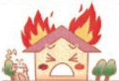
火災による損害も