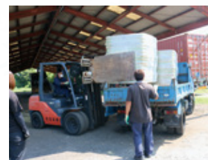
乾牧草の積み込み