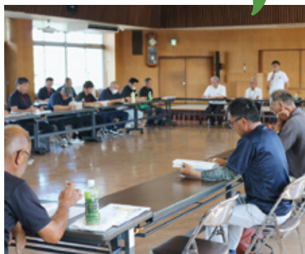
協議を行う部会代表者