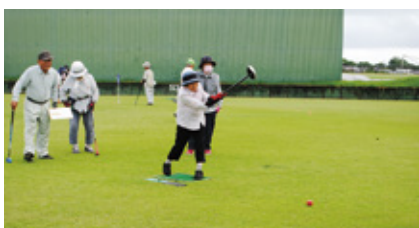
元気にプレーする会員ら

県大会は、10月25日にひなた宮崎県総合運動公園で行われ、県内JAの地区本部代表者が集結します。