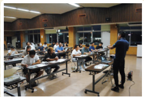
メーカーの説明を熱心に聞く参加盟友