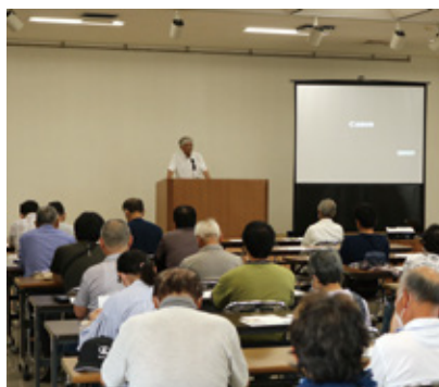
永山部会長あいさつ