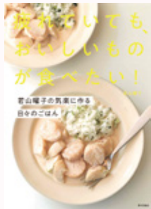
著・若山曜子 定価1,650円(税込)