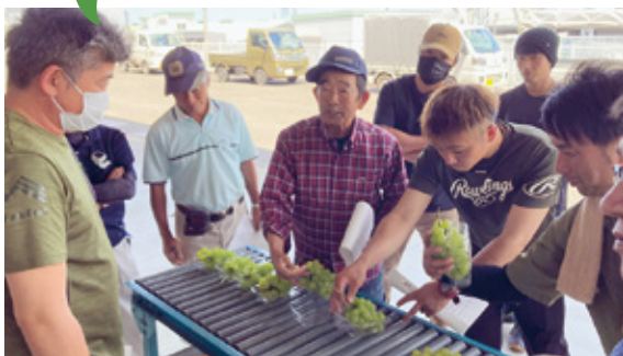
目揃えを行う専門部員

特に房の形状やなりくちの状態、キズの度合いはそれぞれ手に取って意見をもらい、等級の境を入念に目揃えし、カットした物はB品以下にまとめることなども共有しました。