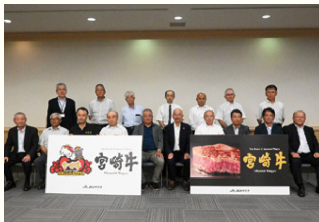
各地区本部の繁殖牛部会長とJ Aみやざきの役員ら

経済連和牛振興課によると、令和6年1月現在、本県の繁殖牛部会員数は4135人で、会員母牛数は8万1456頭となっています。