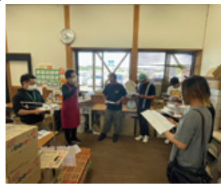
市場視察にて説明を受ける青年部員