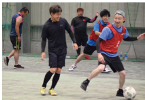
試合をする尾鈴青年部の盟友