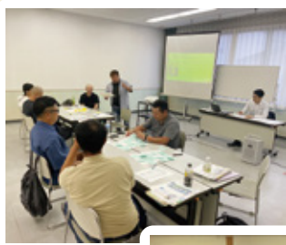
グループワークを行う青年部員