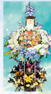
缶詰め盛り 生花セット 16,500円(税込)