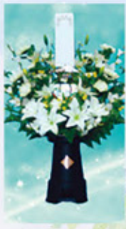
回転灯 上盛花2号(1対) 22,000円(税込) 白色 高さ約1m