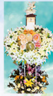
果物盛り 生花セット 16,500円(税込)