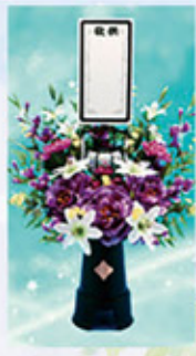
回転灯 上盛花2号(1対) 22,000円(税込) 紫色 高さ約1m