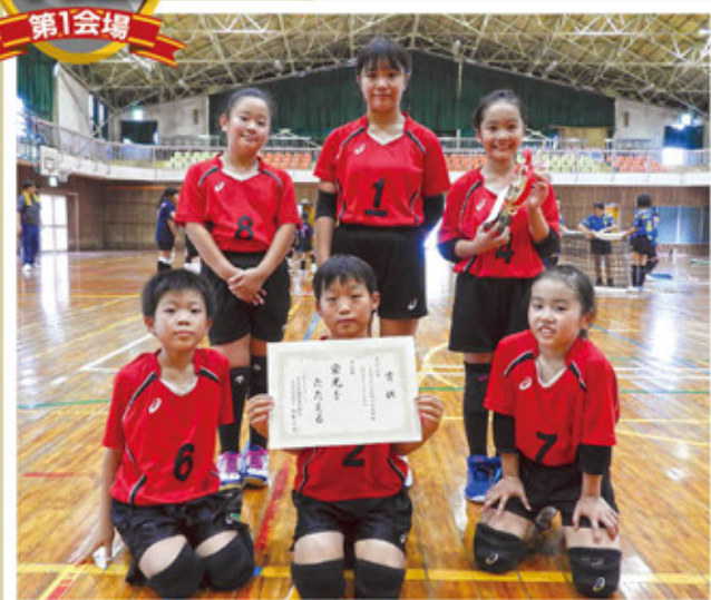
門川少女バレーボールクラブ