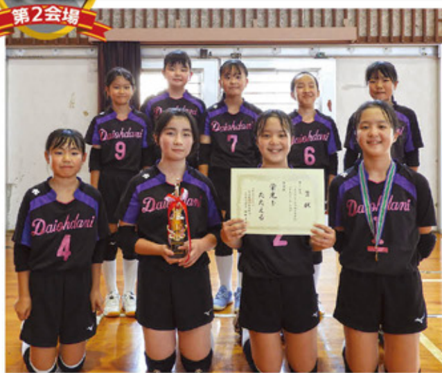
大王谷学園少女バレーボールクラブ