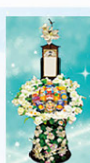
缶詰め盛り 11,000円(税込)