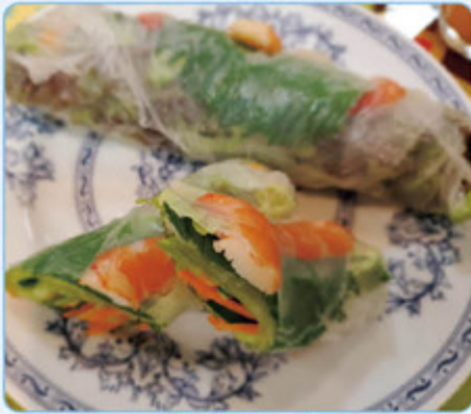
ゴイクン(ベトナム風春巻き)