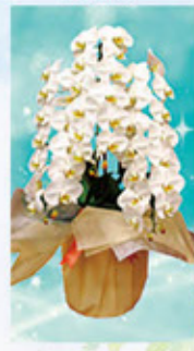
胡蝶蘭 22,000円(税込) 季節によって金額の 変動があります。