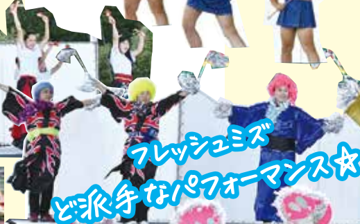
フレッシュミズ ど派手なパフォーマンス☆