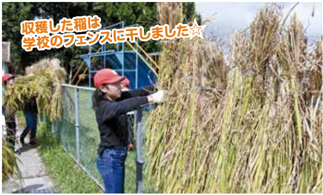
収穫した稲は学校のフェンスに干しました☆