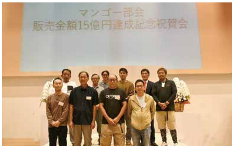
受賞された部会員の皆さま