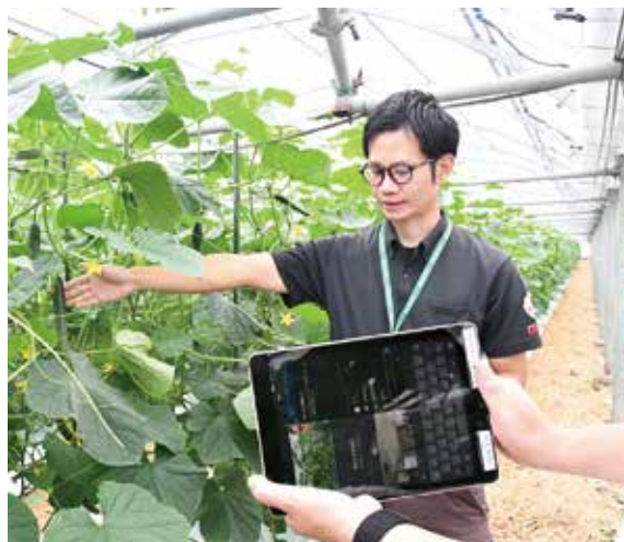
胡瓜の圃場中継を繋ぐ