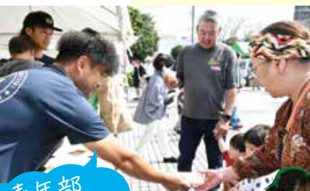
青年部 お米ふるまい