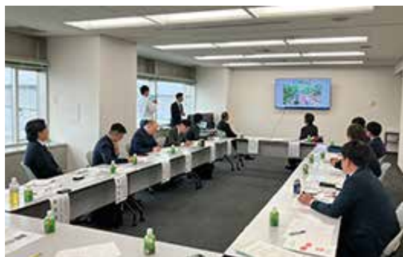
トマト類部会会議

またキュウリ・丸トマト・ミニトマトの各圃場をリモート中継し、生育状況について、現場の指導員が報告を行いました。東京の会場では、部会役員が補足説明を交えながら、酷暑の影響や例年の状態との違いについて質疑応答などを行いました。