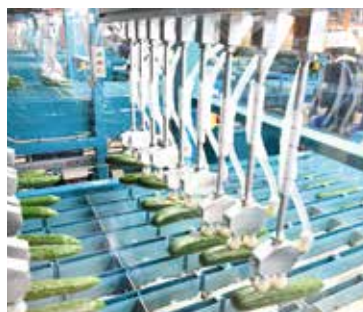
選果機稼働の様子