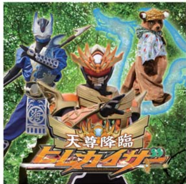
ヒムカイザーショー 11:00～11:30