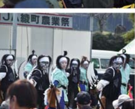
郷土芸能(昨年の様子)