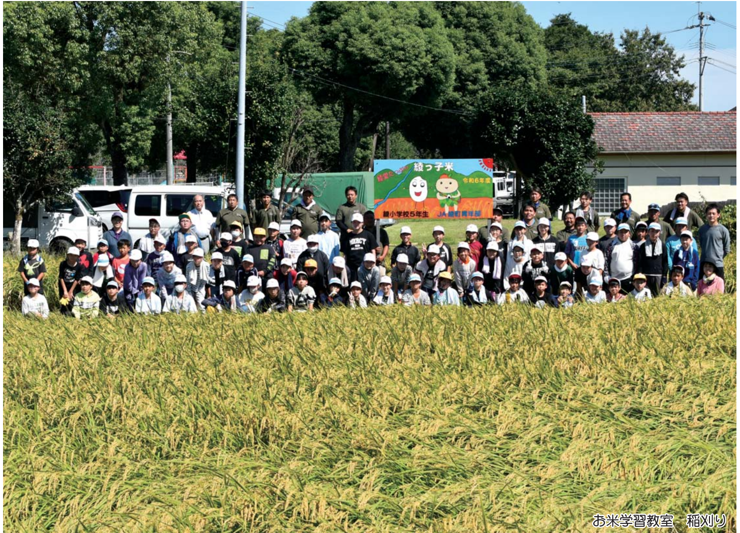
お米学習教室 稲刈り