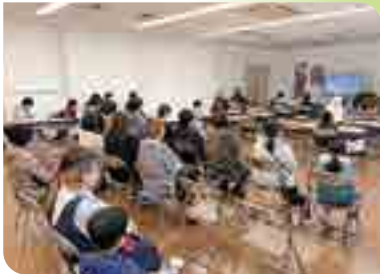
動画を見て勉強中