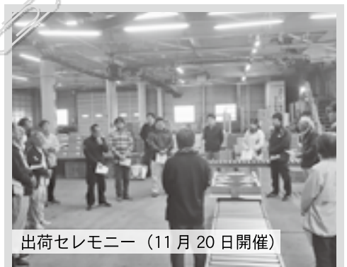
出荷セレモニー（11月20日開催）