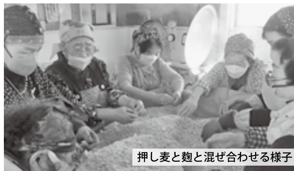
押し麦と麴と混ぜ合わせる様子

11月28日・30日、女性部餺飩支部の部員ら10名は酒谷加工場で毎年恒例の味噌づくりを行いました。28日に、押し麦と米麴を混ぜ合わせる作業を行い、30日に、前回作ったものに蒸した大豆と塩を混ぜ合わせ、つぶして丸めました。今回造ったみそは、各家庭に持ち帰り、半年ほど熟成させ、完成となります。参加した女性部員は「安全・安心で無添加の美味しい味噌ができます。食べるのが楽しみです」と話しました。