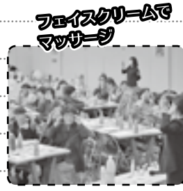
フェイスクリームで マッサージ