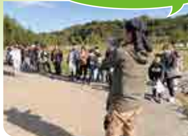
収穫前の注意点を話します