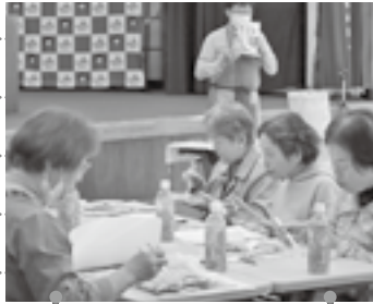
和風だしを使ったサラダを試食