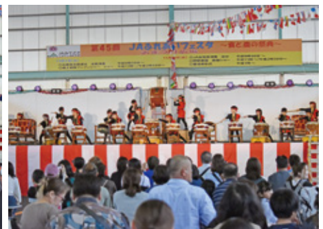
子どもたちによる太鼓演奏