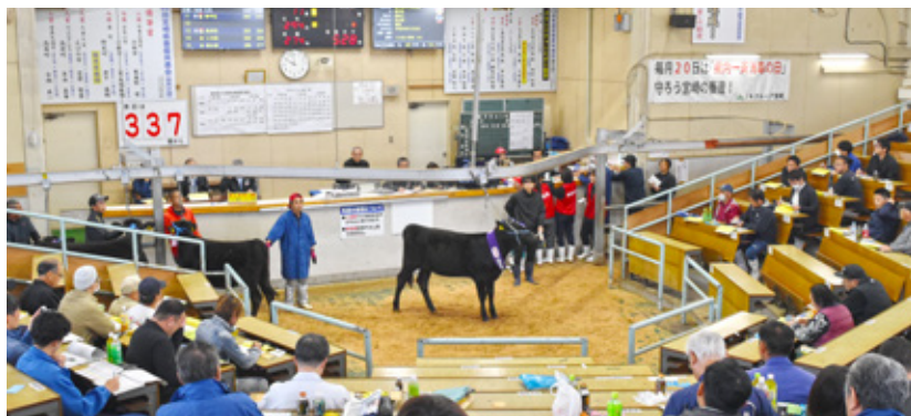
11月期子牛セリ市風景 (単位:頭、円)

《JA共済事故受付センター》 365日 24時間対応 フリーダイヤル ☎0120-258-931