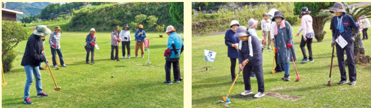
グラウンドゴルフ大会の様子