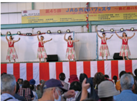
女性部によるダンスと舞踊