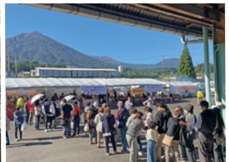
長い行列が出来た焼肉コーナー