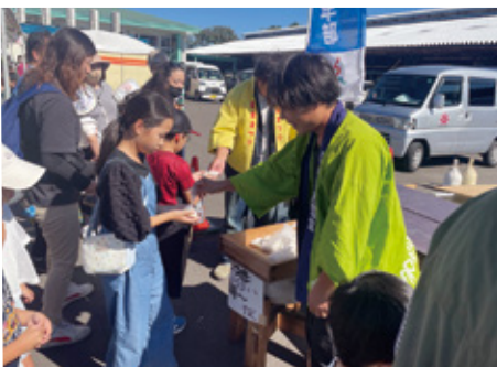
青年部によるふるまいの様子

初日は、大雨で足元の悪い中でしたが、2日間で多くの方にご来場いただき、誠にありがとうございました。