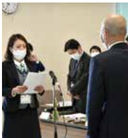
共済渉外決意表明 福永職員