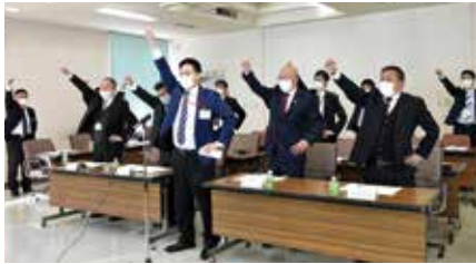
ガンバロー三唱 小島職員