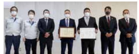
南宮崎支店茄子部会