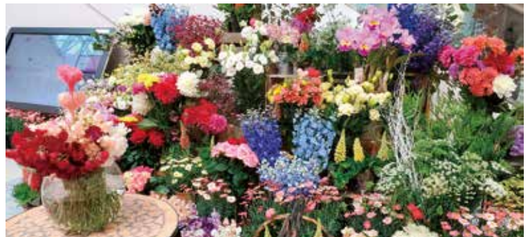
イオンモール内にたくさんの花が飾られました

新型コロナウイルスの影響により、式典やイベントの中止が続き、花の需要が激減しています。今回の販売会はバレンタインに花を贈ろうという企画であり、販売による消費拡大、また市内花きを使用したフォトスポットを設置し、花のPRを行いました。