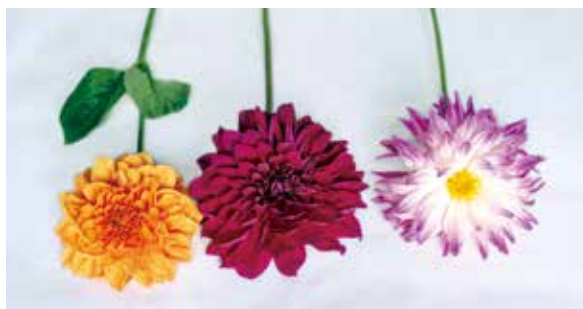
花材 ・ ダリア