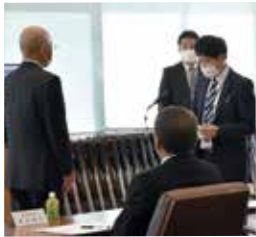
金融渉外決意表明 沖田職員、園目職員、湯浅職員