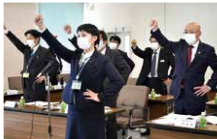
ガンバロー三唱 平崎職員