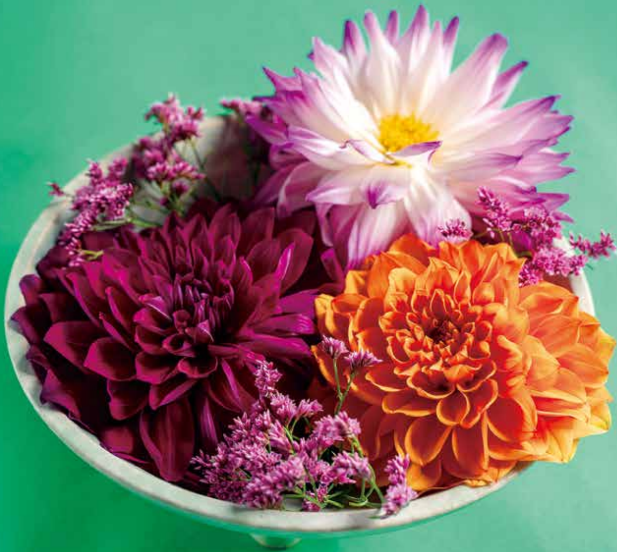
デザイン・製作 ● 吉野花壇 (代表) 吉野恒男