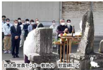
佐土原営農センター敷地内 慰霊碑にて

JA宮崎中央役員、生産者、行政の方々に参加し、佐土原地区にて畜魂祭が行われました。参加者は家畜への慰霊を込めて玉串奉てんを行いました。