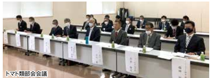
トマト類部会会議