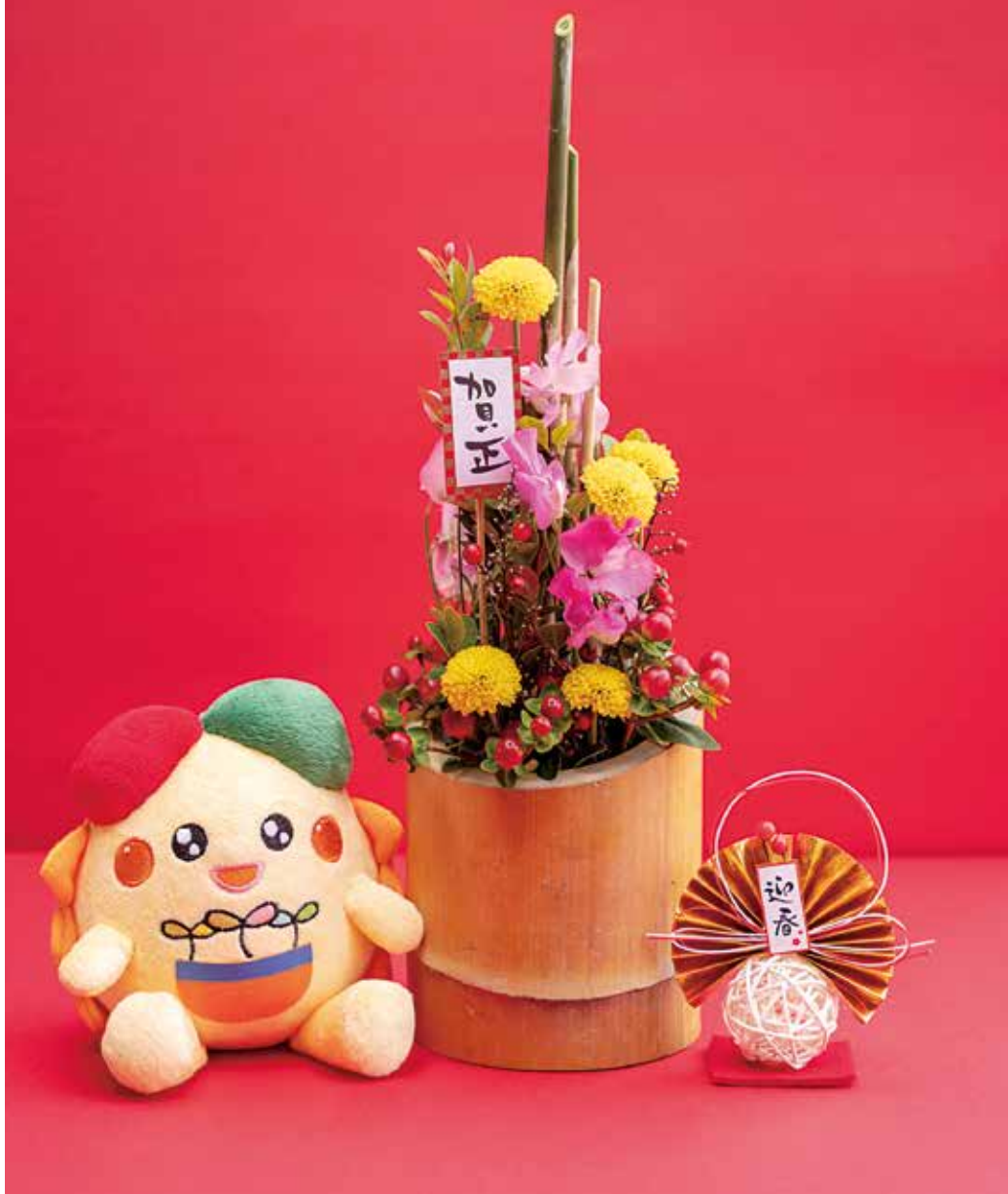
デザイン・製作 ● 吉野花壇 (代表) 吉野恒男