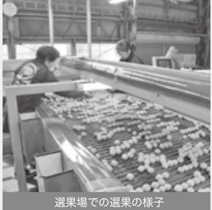
選果場での選果の様子