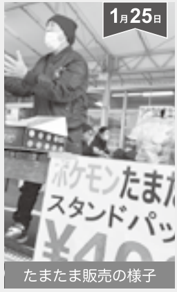
たまたま販売の様子