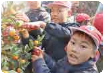
上手に収穫できたよ