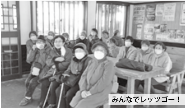
みんなでレッツゴー！

1月9日、女性部飢肥支部は部員同士の親睦とJR日南線の活用を目的に部員44名で道の駅くしまを訪れました。飢肥駅から串間駅までの道のりでは、普段見ない車窓からの眺めを見ながら会話を楽しみあつという間に串間駅に到着しました。