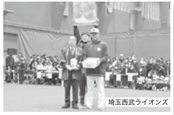
埼玉西武ライオンズ