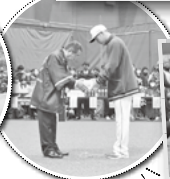
!!頑張ってください!!